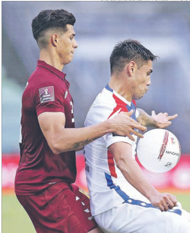
Estadio Olímpico de la UCV Árbitro: Patricio Loustau (ARG)