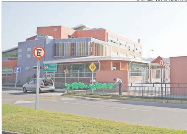
LOS APODERADOS del establecimiento han dado una larga batalla.