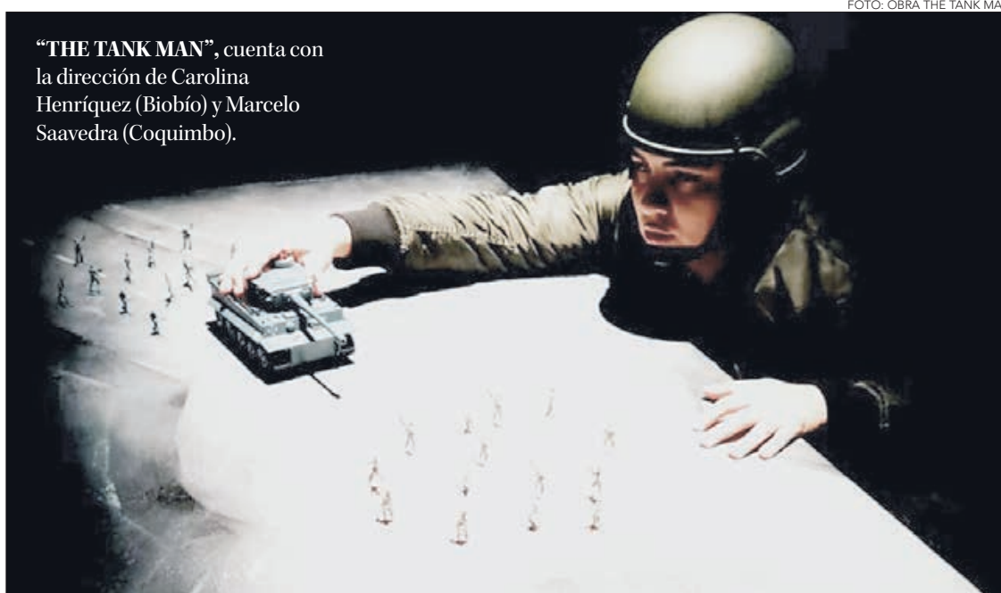
FOTO: OBRA THE TANK MAN