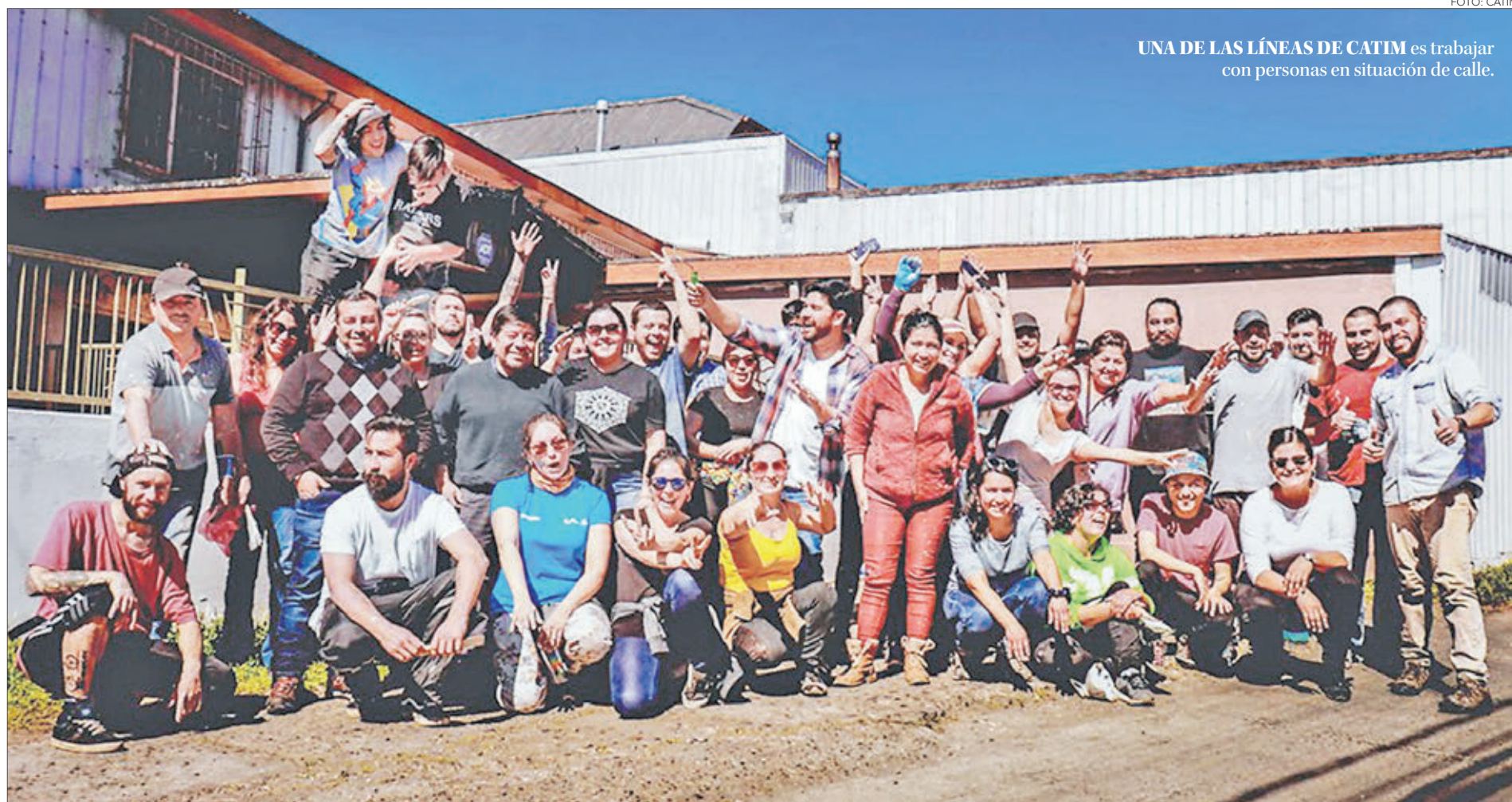
UNA DE LAS LÍNEAS DE CATIM es trabajar con personas en situación de calle.

La latencia de las problemáticas vinculadas a las manifestaciones de la pobreza multidimensional y la proyección de su agudización tras la crisis sanitaria de la Covid-19 hacen vislumbrar importantes desafíos futuros, en tanto la situación se extiende, pero las necesidades estaban antes y están hoy. Por tanto, su abordaje no puede esperar.