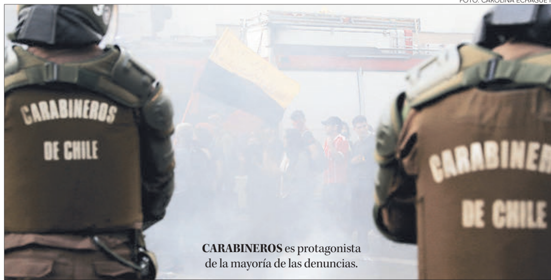
CARABINEROS es protagonista de la mayoría de las denuncias.

Además, se presentaron 248 querrelas por delitos relacionados a vulneración de los derechos esenciales. La mayoría de los episodios ocurrieron en la vía pública.