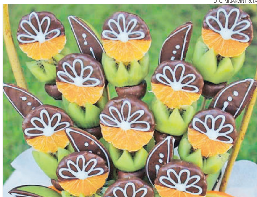
MI JARDÍN DE FRUTAS lleva sus pedidos a domicilio para sobrevivir a 7 meses de pandemia.