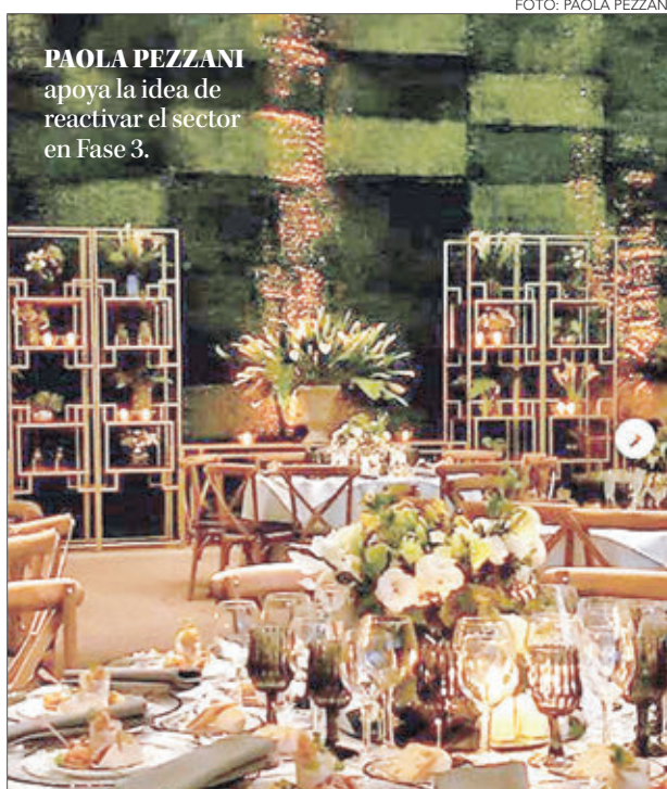
PAOLA PEZZANI apoya la idea de reactivar el sector en Fase 3.

Otro punto relevante para la banquetera es el efecto que ha tenido la caída de la actividad en los estudiantes