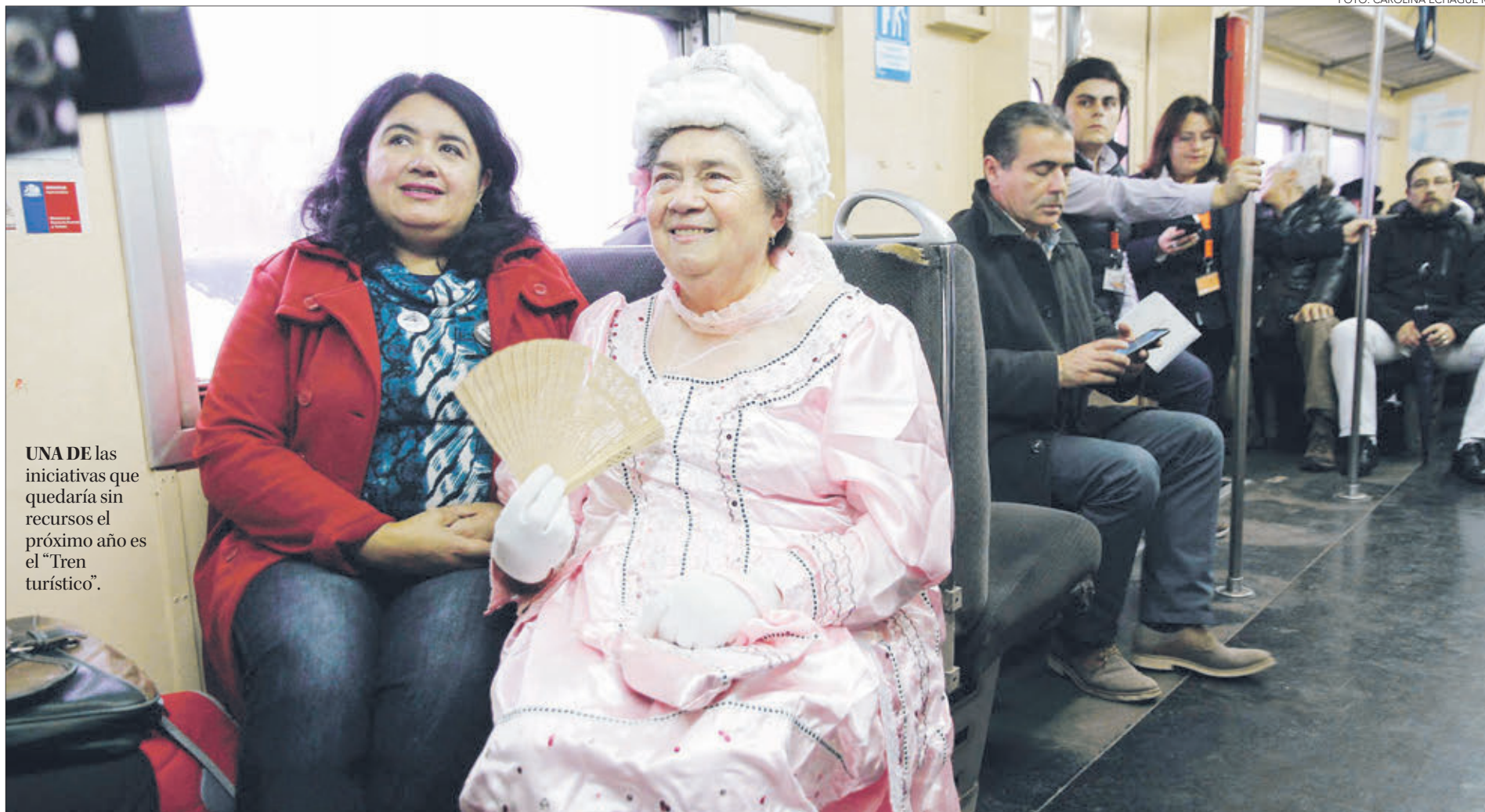
UNA DE las iniciativas que quedaría sin recursos el próximo año es el "Tren turístico".

DISMINUCIONES DEL 100% DE RECURSOS PARA EL PRÓXIMO AÑO