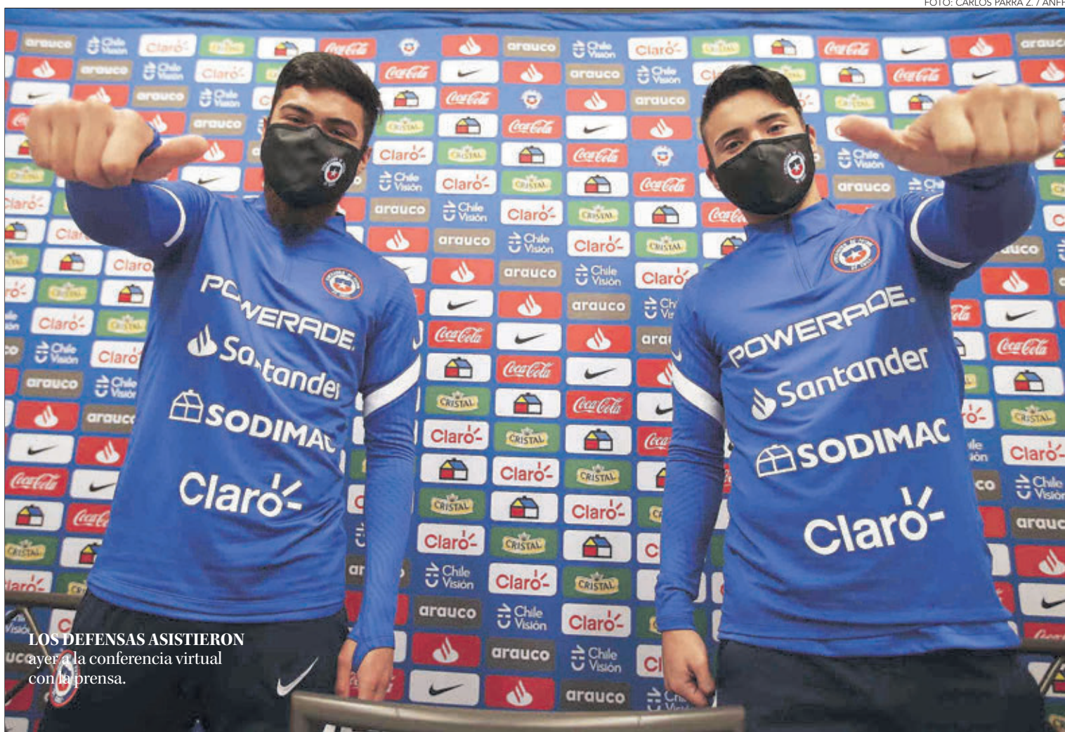
LOS DEFENSAS ASISTIERON ayer a la conferencia virtual con la prensa.