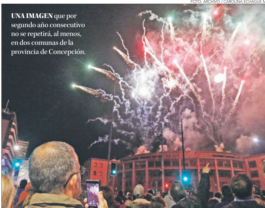
SAN PEDRO DE LA PAZ Y TALCAHUANO

"Queremos evitar riesgos, queremos evitar una mayor propagación de este virus. Y