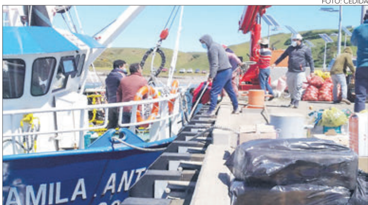
AHORA ORGANIZAN campaña en apoyo a los menores de la isla.