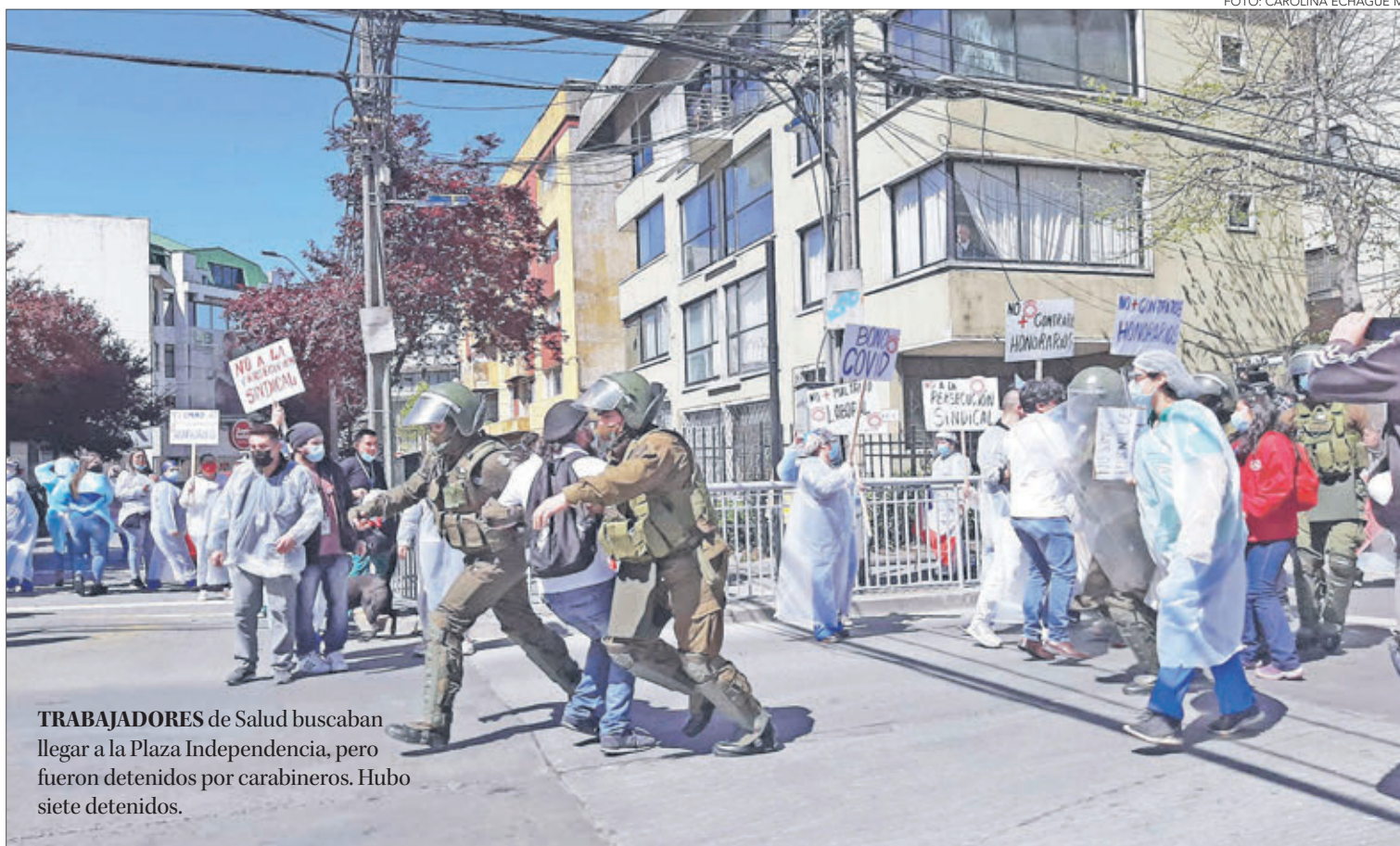
TRABAJADORES de Salud buscaban llegar a la Plaza Independencia, pero fueron detenidos por carabineros. Hubo siete detenidos.

En otro plano, trabajadores de primera línea, agrupados en Federa-