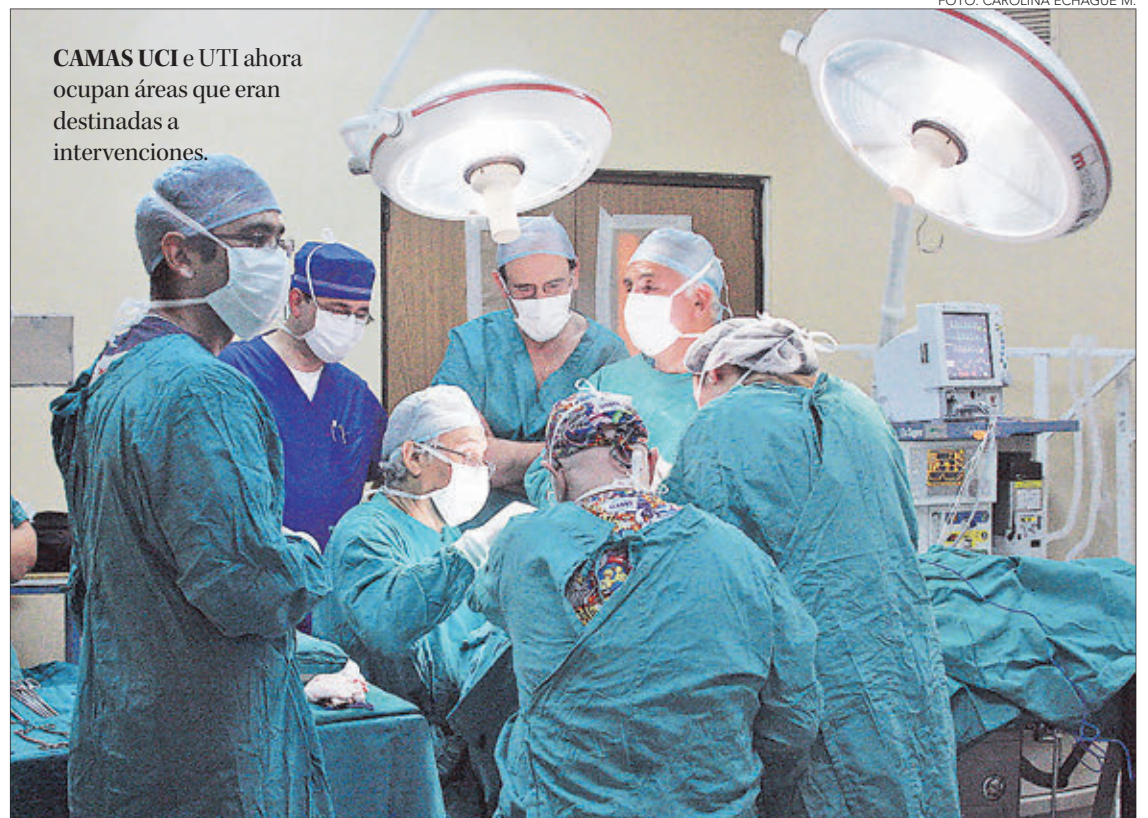
CAMAS UCI e UTI ahora ocupan áreas que eran destinadas a intervenciones.

El Hospital Regional, principal centro bajo la custodia del SSC, ha