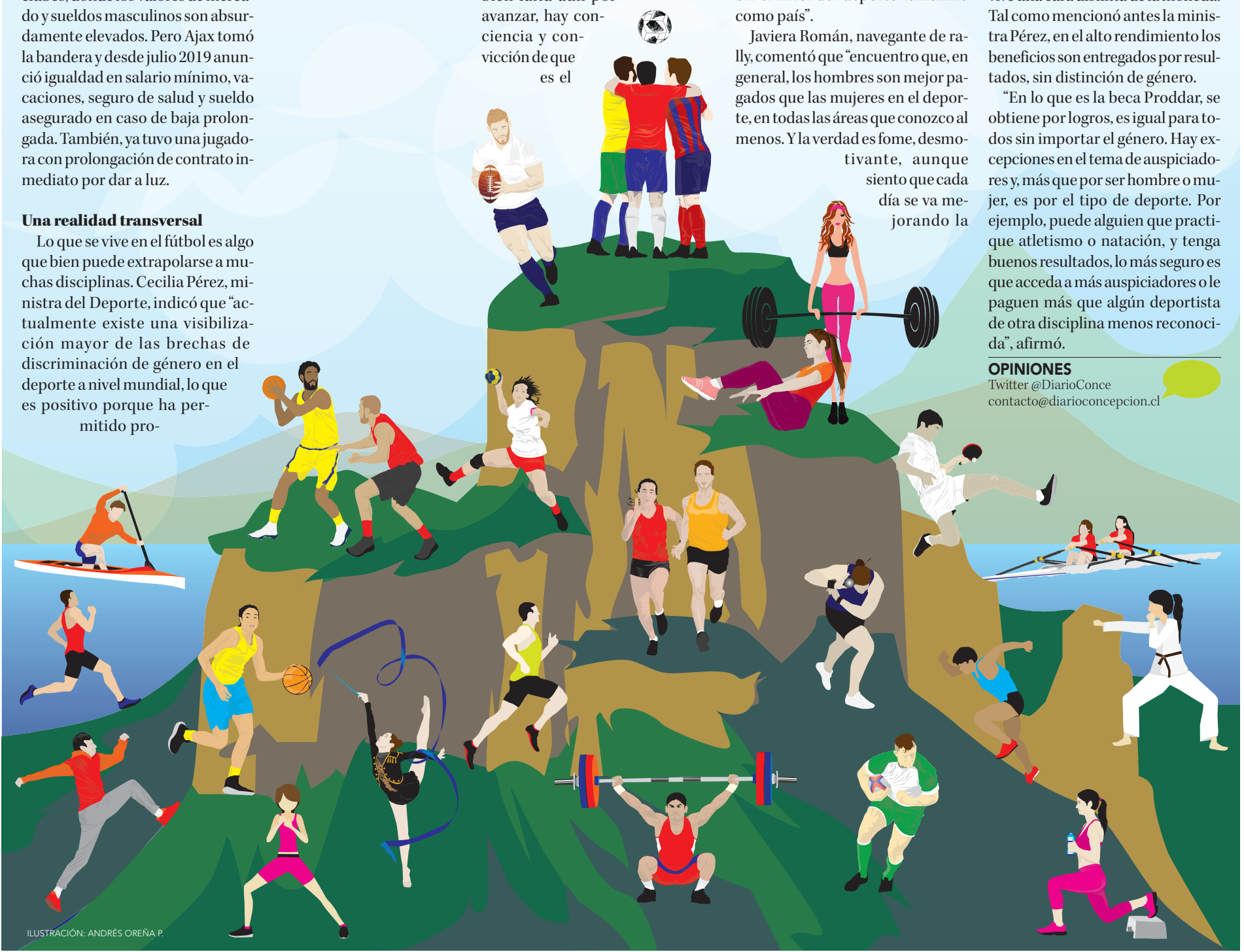
ILUSTRACIÓN: ANDRÉS OREÑA P.

Twitter @DiarioConce contacto@diarioconcepcion.cl