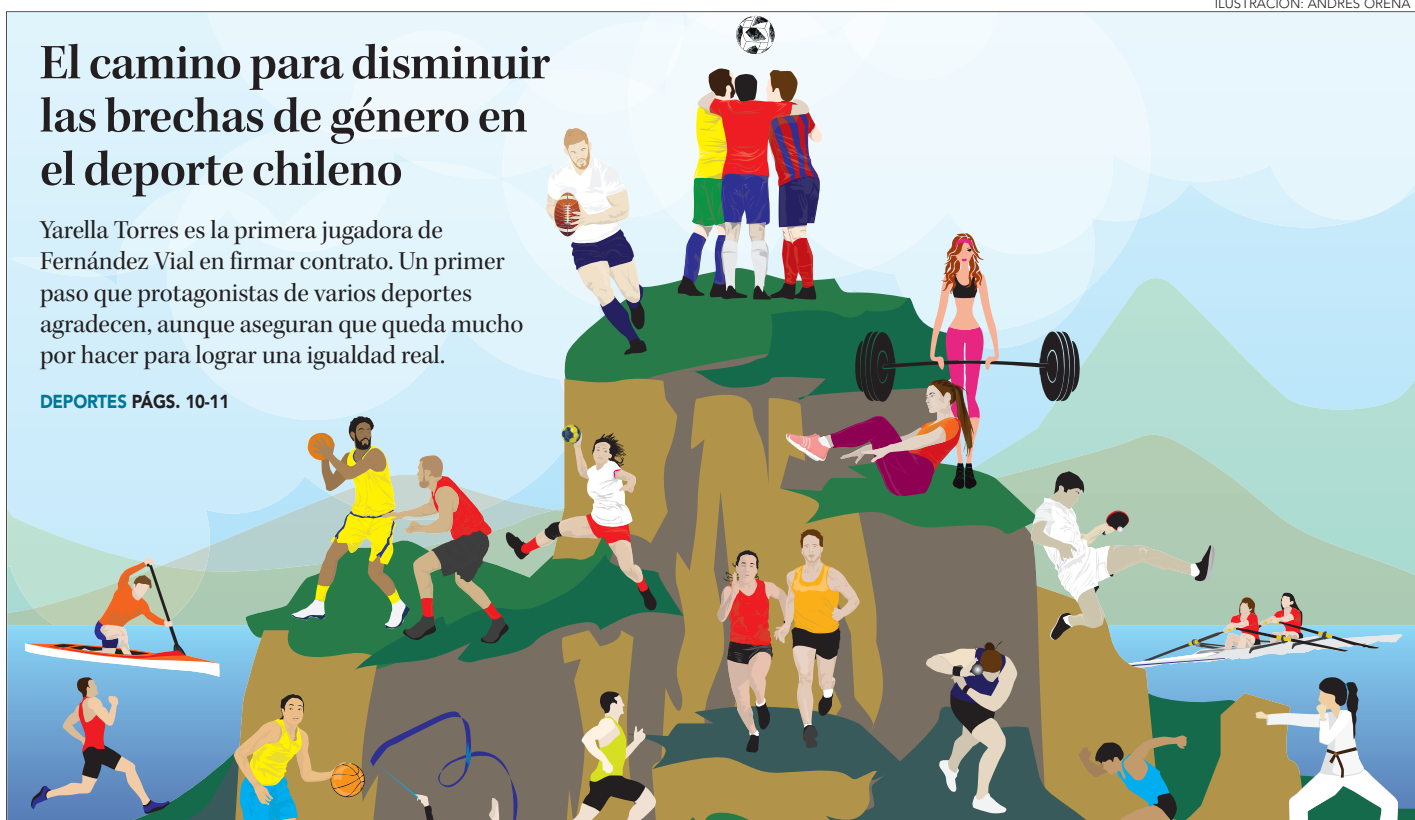
ILUSTRACIÓN: ANDRÉS OREÑA P.