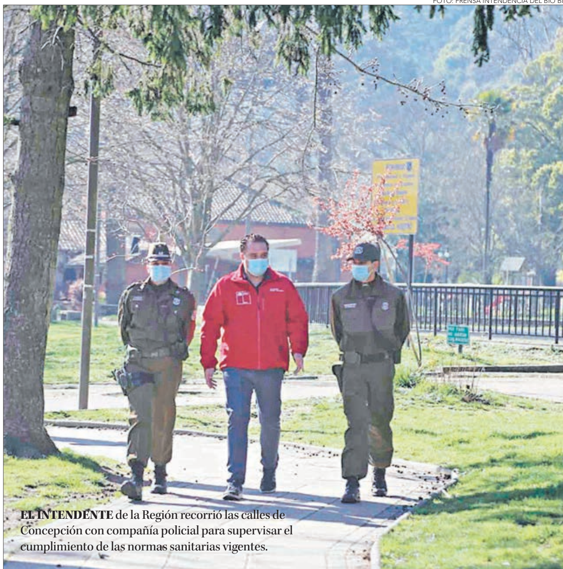
EL INTENDENTE de la Región recorrió las calles de Concepción con compañía policial para supervisar el cumplimiento de las normas sanitarias vigentes.