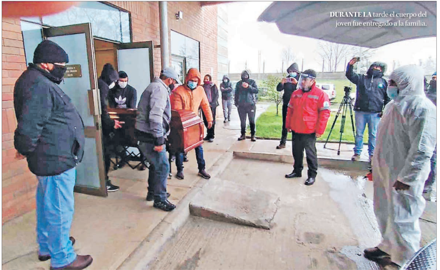
DURANTE LA tarde el cuerpo del joven fue entregado a la familia.

El alcalde de Cañete, Jorge Radonich, emplazó al Ejecutivo para que restablezca el Estado de Derecho. “No vemos alguna acción que sea efectiva para que podamos vivir en paz. Carabineros ni siquiera tiene los vehículos adecuados para concurrir a estos llamados. El Estado está fallando, está dejando de lado a habitantes de Chile, de un país que fue muy importante en un tiempo. Nos sentimos solos en este tipo