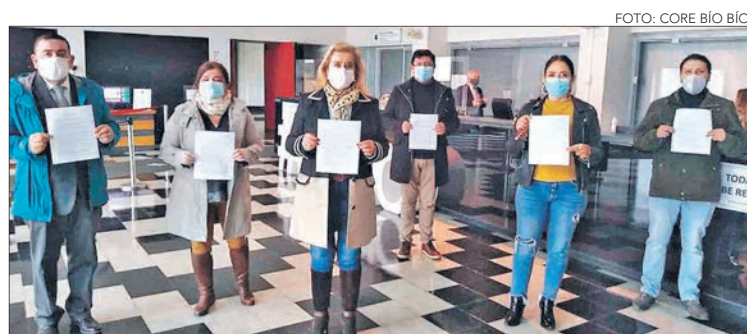
LOS CORES entregaron el documento en Intendencia.

Twitter @DiarioConcepcion contacto@diarioconcepcion.cl