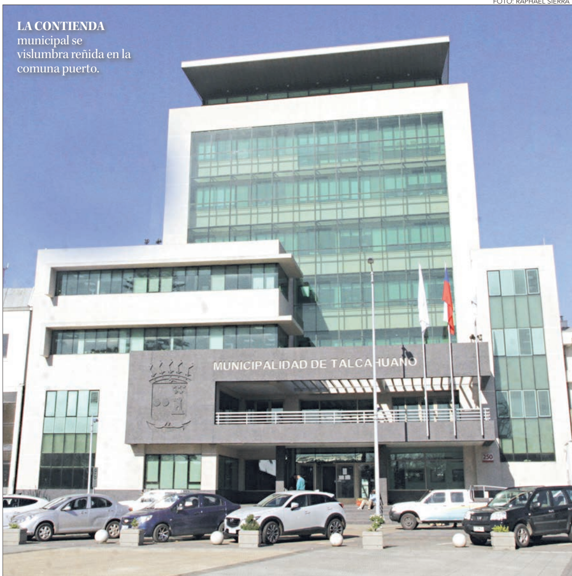
LA CONTIENDA municipal se vislumbra reñida en la comuna puerto.