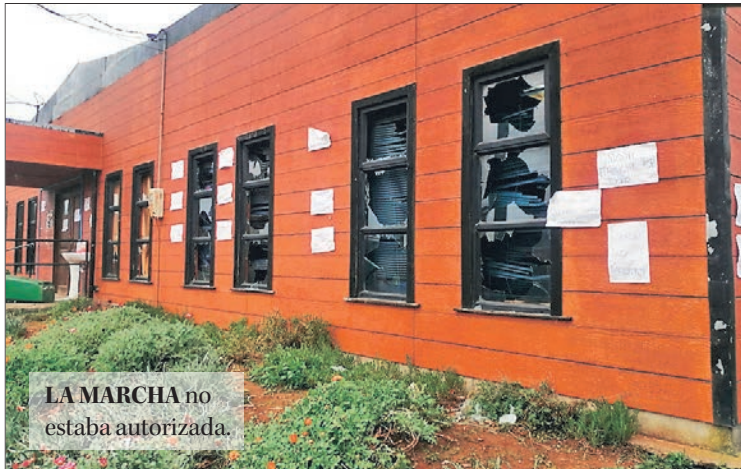
LA MARCHA no estaba autorizada.

“Porque tenemos que cuidarnos por nuestras familias. Debemos resguardar la salud de nuestros abuelos, padres y familiares. Tenemos que ser prudentes en las salidas y tomar todas las precauciones de higiene necesarias para evitar los contagios”.