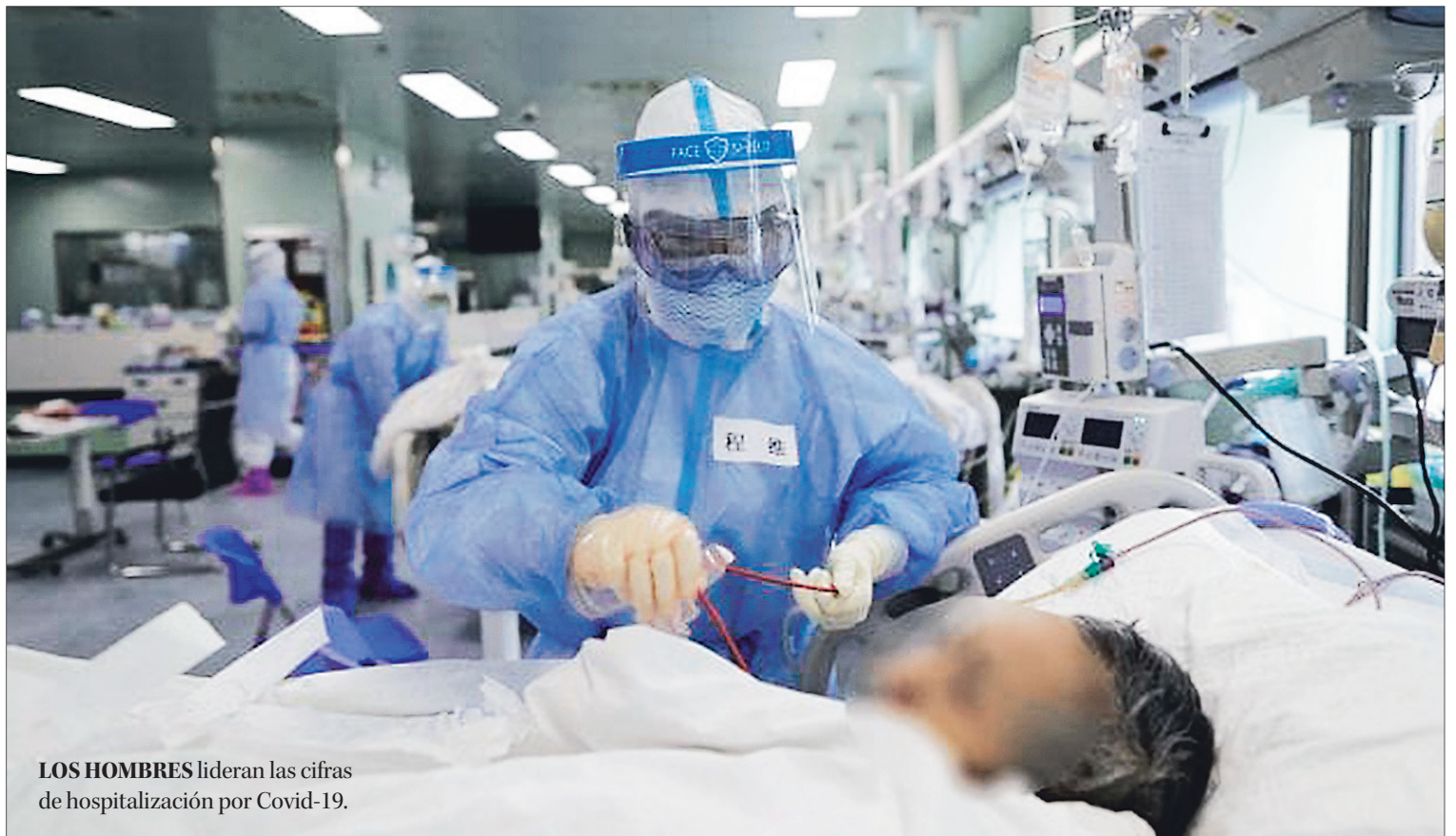
LOS HOMBRES lideran las cifras de hospitalización por Covid-19.

Según edad, el grupo con mayor número de contagios se da en hombre entre 25 y 29 años, y entre 30 y 34 años, que registran 12,4% y 11,7% respectivamente. Las mujeres en el mismo tramo de edad muestran la mayor tasa de contagios, con 12,6%