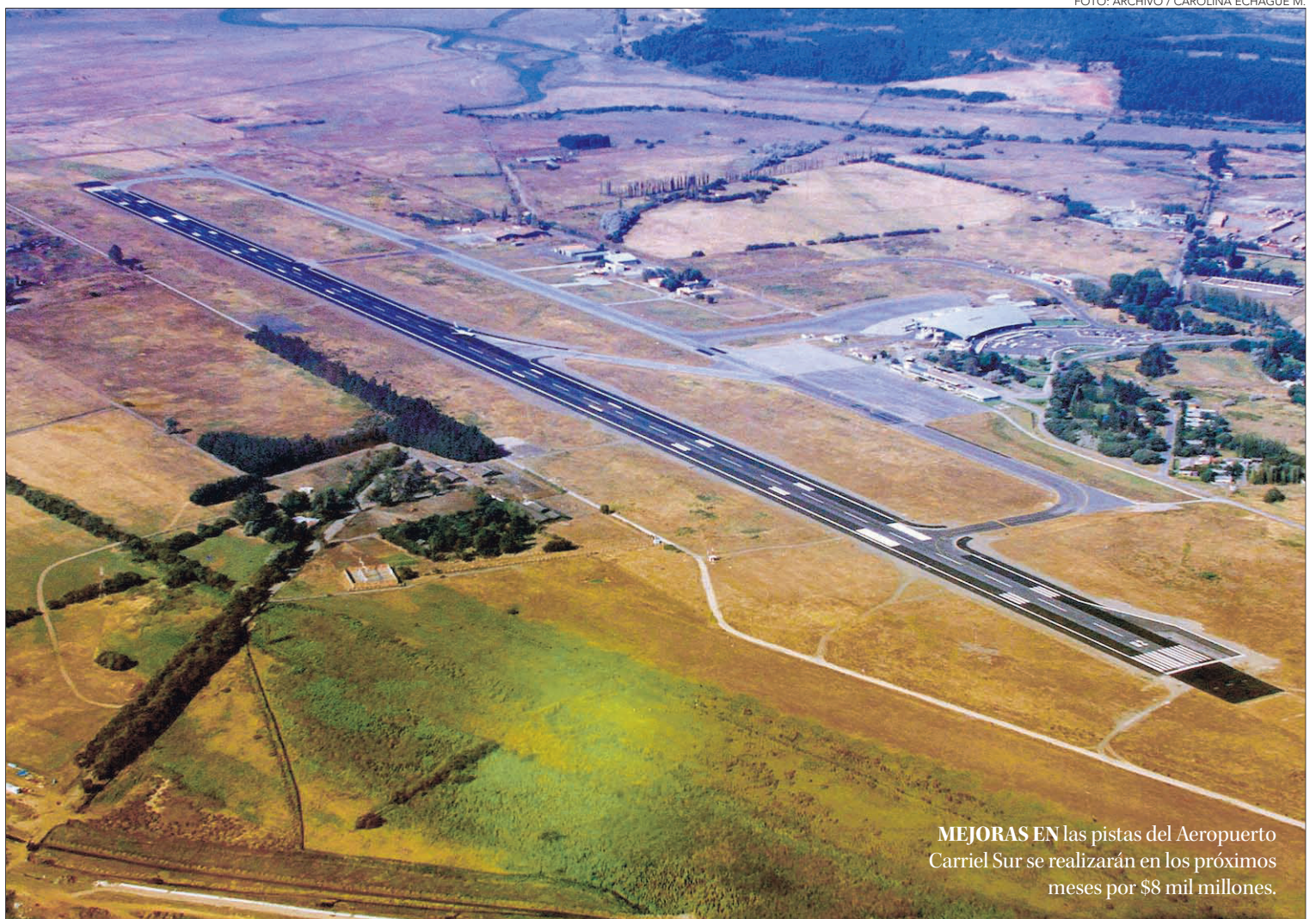
MEJORAS EN las pistas del Aeropuerto Carriel Sur se realizarán en los próximos meses por $8 mil millones.

El intendente Giacaman reiteró el compromiso en esta materia. “Desde octubre a la fecha, hemos tenido una serie de desafíos y eso no signi-