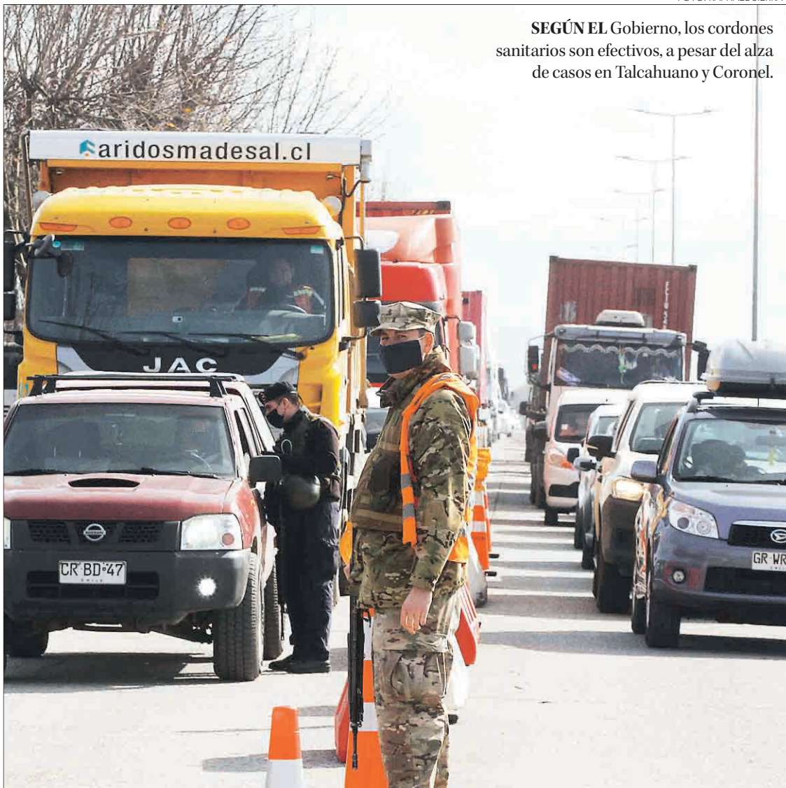
SEGÚN EL Gobierno, los cordones sanitarios son efectivos, a pesar del alza de casos en Talcahuano y Coronel.

Producto del alza en activos que se presenta en la provincia el alcalde de Talcahuano, Henry Campos, solicitó a través de una carta dirigida al Presidente, Sebastián Piñera, que la provincia de Concepción retroceda a Fase 2 ante las aglomeraciones vistas en