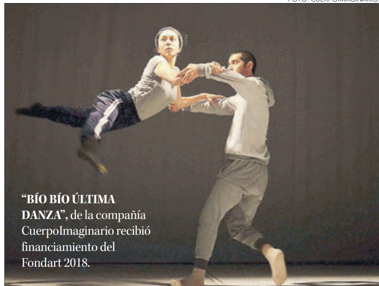
“BÍO BÍO ÚLTIMA DANZA”, de la compañía CuerpoImaginario recibió financiamiento del Fondart 2018.

DESDE HOY Y HASTA EL PRÓXIMO 16 DE SEPTIEMBRE