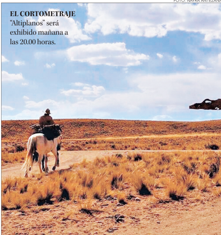
EL CORTOMETRAJE “Altiplanos” será exhibido mañana a las 20.00 horas.

“Se han exhibido 33 cortos desde mayo a la fecha y en total son más de 60 cortos durante todo el año y 5 largos del programa ‘Cine al Oído’. Dentro de éste se realizó un ciclo especial de radioteatro en conjunto con Chileactores y Gestionarte, el cual trató de 5 películas en este formato, escuchándose a través de Radio Millaray de Lebu y que luego vendrán otras radios comunales en la Región, para un público inclusivo y adultos mayores que no tienen acceso a internet”, explicó Pino.