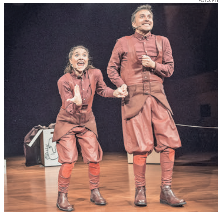
“LUCILA, LUCES DE GABRIELA” es una de las propuestas teatrales que tuvo que adaptar su formato para ser parte de este ciclo.

OPINIONES Twitter @DiarioConce contacto@diarioconcepcion.cl