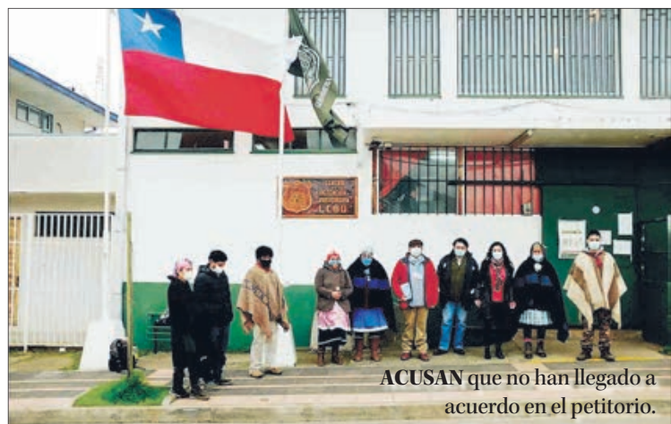
ACUSAN que no han llegado a acuerdo en el petitorio.

conveniente para el gobierno que esto ocurra. “El gobierno tiene muchas contradicciones, pero claro el resultado del plebiscito será mayoritario al cambio constitucional, y es