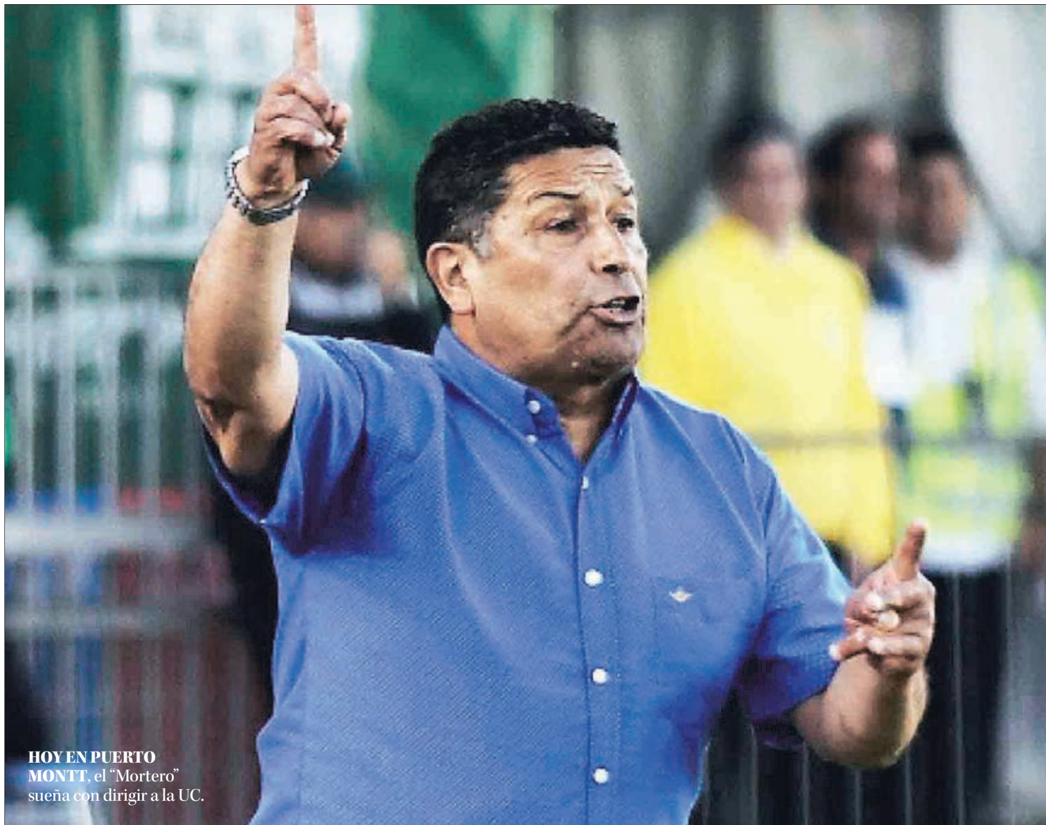
HOY EN PUERTO MONTT, el “Mortero” sueña con dirigir a la UC.

Hoy el presente de Naval está muy, pero muy lejos de aquellos años donde incluso representaron a Chile a nivel internacional. “Da mucha tristeza. Después de la gran organización que tenía el equipo con la Armada de Chile al desorden que hay ahora, es muy penoso lo que ha llevado al club a prácticamente la desaparición. Esperamos que aparezca gente honesta que quiera hacer surgir al equipo y que