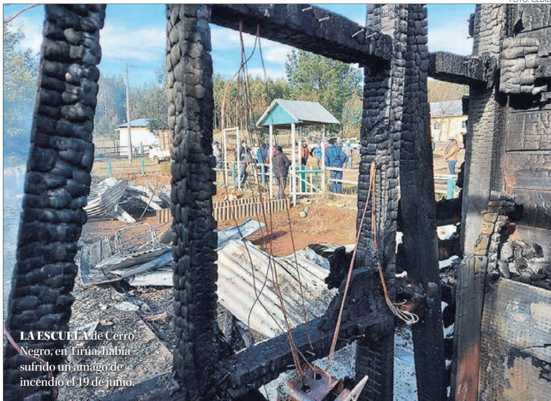
LA ESCUELA de Cerro Negro, en Tirúa, había sufrido un amago de incendio el 19 de junio.

El último incidente ocurrió la noche del miércoles y afectó a la Escuela Pedro Etchepare. Esto se suma a las manifestaciones que terminaron con 14 detenidos.