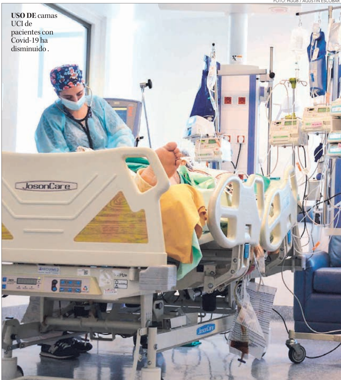
USO DE camas UCI de pacientes con Covid-19 ha disminuido.

También se refleja una diferencia de cifras en las víctimas fatales. En la última jornada se sumaron dos fallecidos con los que la Región acumula 82, pero según el informe epidemiológico hay cinco decesos más que corresponden a personas que fallecieron a causa de la Covid-19 o relacionadas con este que están inscritas en el Registro Civil y codificadas por el Departamento de Esta-