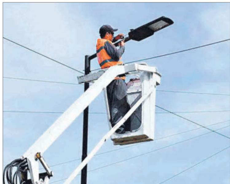
EL DICTAMEN por las luminarias se conoció la semana pasada.

Twitter @DiarioConce contacto@diarioconcepcion.cl