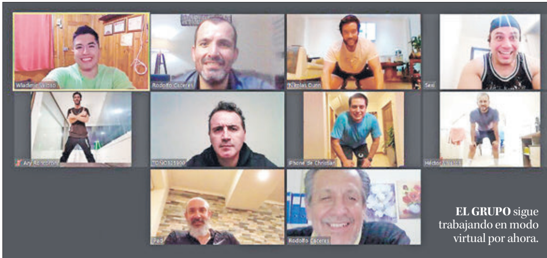
EL GRUPO sigue trabajando en modo virtual por ahora.