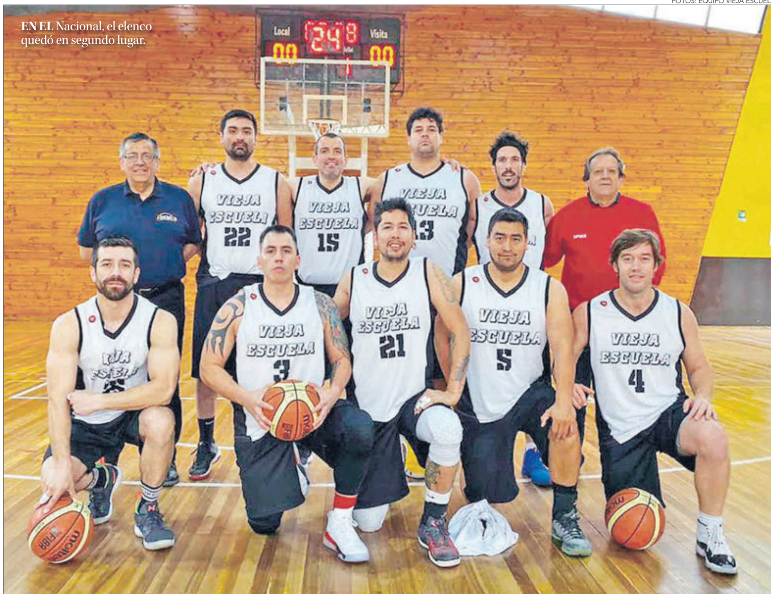
EN EL Nacional, el elenco quedó en segundo lugar.