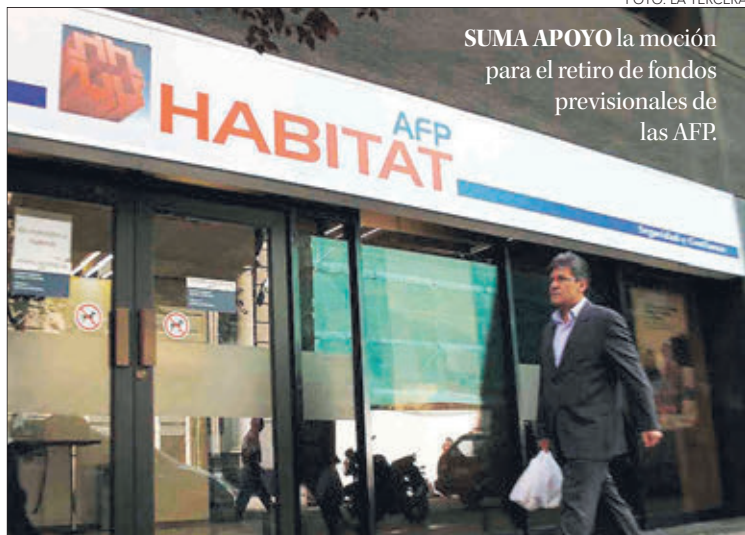
FOTO: LA TERCERA SUMA APOYO la moción para el retiro de fondos previsionales de las AFP.

“Quédate en casa porque es la mejor forma de detener la propagación del virus, hazlo por el bienestar de tu familia y seres queridos. Como centros turísticos la crisis nos ha afectado, pero esperamos superar la pandemia, para que las vacaciones sean con la presencia de todas y todos”.