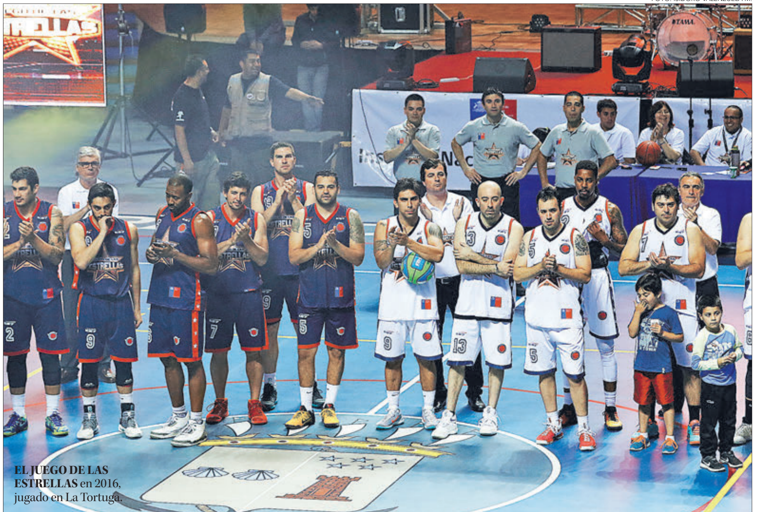
EL JUEGO DE LAS ESTRELLAS en 2016, jugado en La Tortuga.

El delicado momento económico de varios deportistas en plena pandemia, fue una de las grandes razones que motivó a la Asociación de Jugadores de Básquetbol a ponerse de pie y trabajar. Buscan tener una reunión clave con el mundo político.