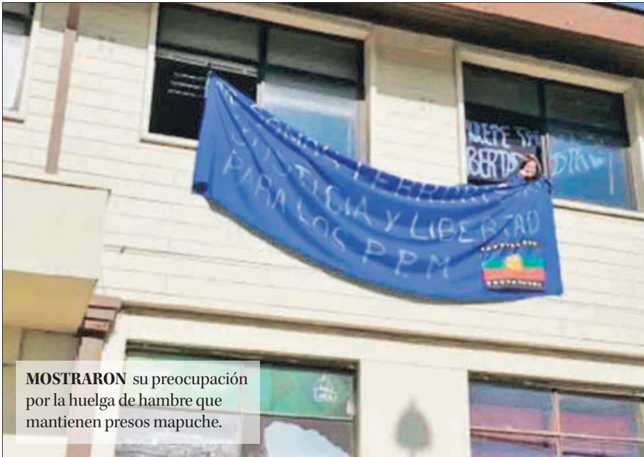
MOSTRARON su preocupación por la huelga de hambre que mantienen presos mapuche.

Manifestaron su preocupación por la presencia de militares en la zona y que no se privilegie el diálogo, el mismo con el cual el Estado emplaza al pueblo mapuche. Exigieron el retiro de los uniformados. “Es una medida de presión por la huelga de hambre que tienen nuestros hermanos en las cárceles”, ratifi-