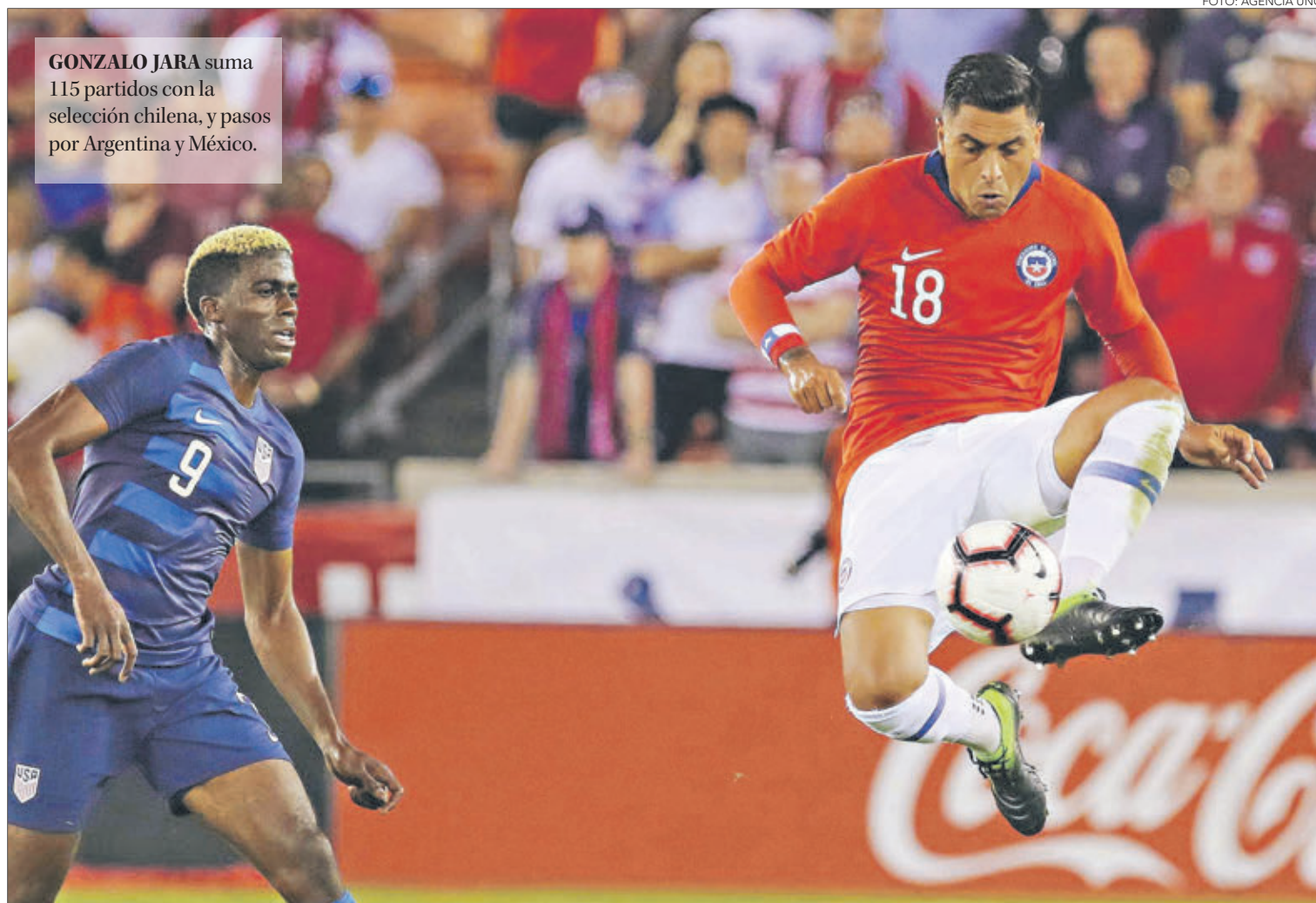
GONZALO JARA suma 115 partidos con la selección chilena, y pasos por Argentina y México.

Al hacer el repaso, aparecen figuras que alcanzaron relevancia no sólo nacional en algunos casos, sino internacional. El debate está abierto.