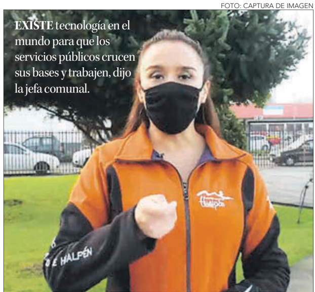
EXISTE tecnología en el mundo para que los servicios públicos crucen sus bases y trabajen, dijo la jefa comunal.

OPINIONES Twitter @DiarioConce contacto@diarioconcepcion.cl