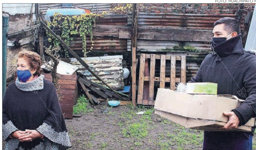
HUACHIPATO PARTIÓ este fin de semana el reparto de cajas con abarrotes.