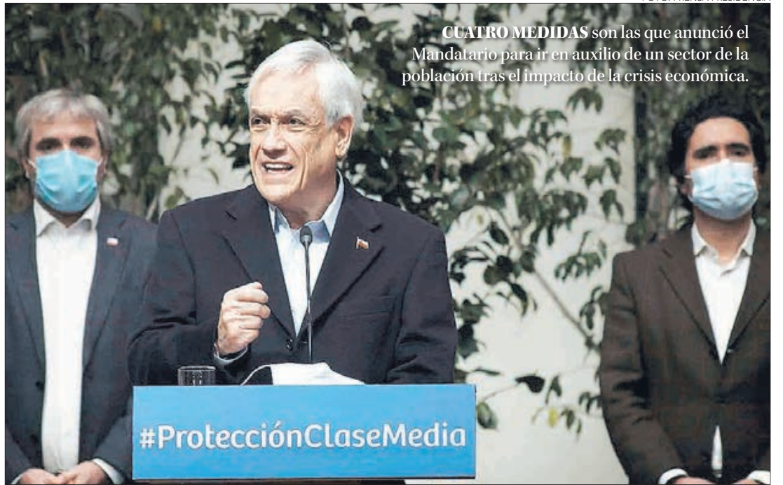
CUATRO MEDIDAS son las que anunció el Mandatario para ir en auxilio de un sector de la población tras el impacto de la crisis económica.

Twitter @DiarioConce contacto@diarioconcepcion.cl