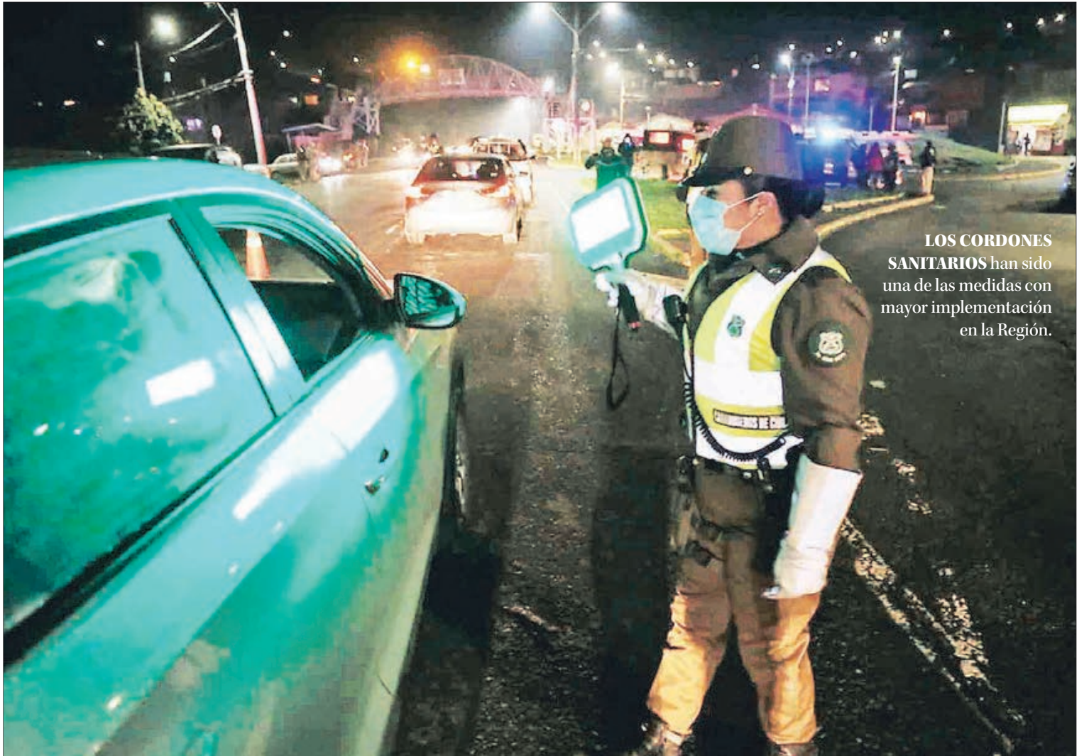
LOS CORDONES SANITARIOS han sido una de las medidas con mayor implementación en la Región.

Carrasco añade que “también muestra el impacto diferencial que han tenido cuarentenas y cercos sanitarios en el Bío Bío y también en Ñuble, pero también manifiesta de manera muy explícita que hay una parte importante de las personas que se sigue moviendo en la ciudad primordialmente, porque tienen que continuar buscando sustento en términos de trabajo y porque también aún en muchos sectores de la ciudad faltan condiciones para