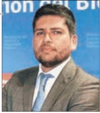
Marco Loyola Q. seremi del Deporte del Bío Bío