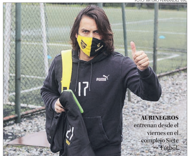
AURINEGROS entrenan desde el viernes en el complejo Siete Fútbol.

Twitter @DiarioConce contacto@diarioconcepcion.cl