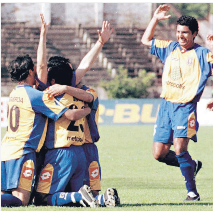
FIGUEROA, RAIN Y SOLÍS llegan al abrazo de un equipo que en todo el segundo semestre perdió solo dos partidos.

Twitter @DiarioConce contacto@diarioconcepcion.cl