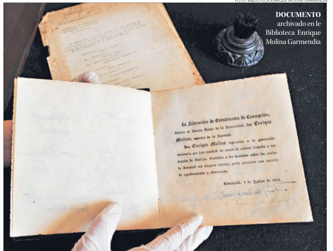
DOCUMENTO archivado en le Biblioteca Enrique Molina Garmendia