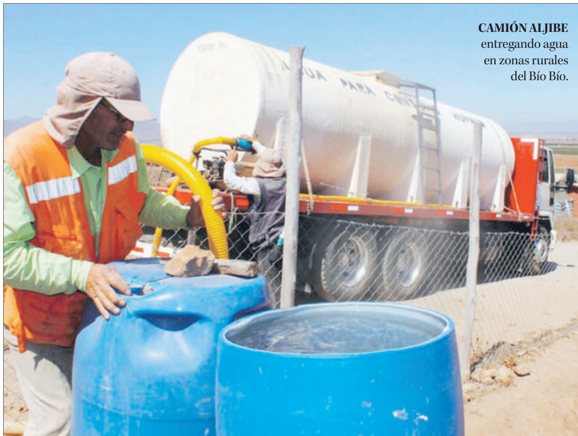
CAMIÓN ALJIBE entregando agua en zonas rurales del Bío Bío.

Académicos de la UdeC dieron a conocer obra escrita que detalla la crisis hídrica que enfrentamos debido al cambio climático y las diferencias de territorio.