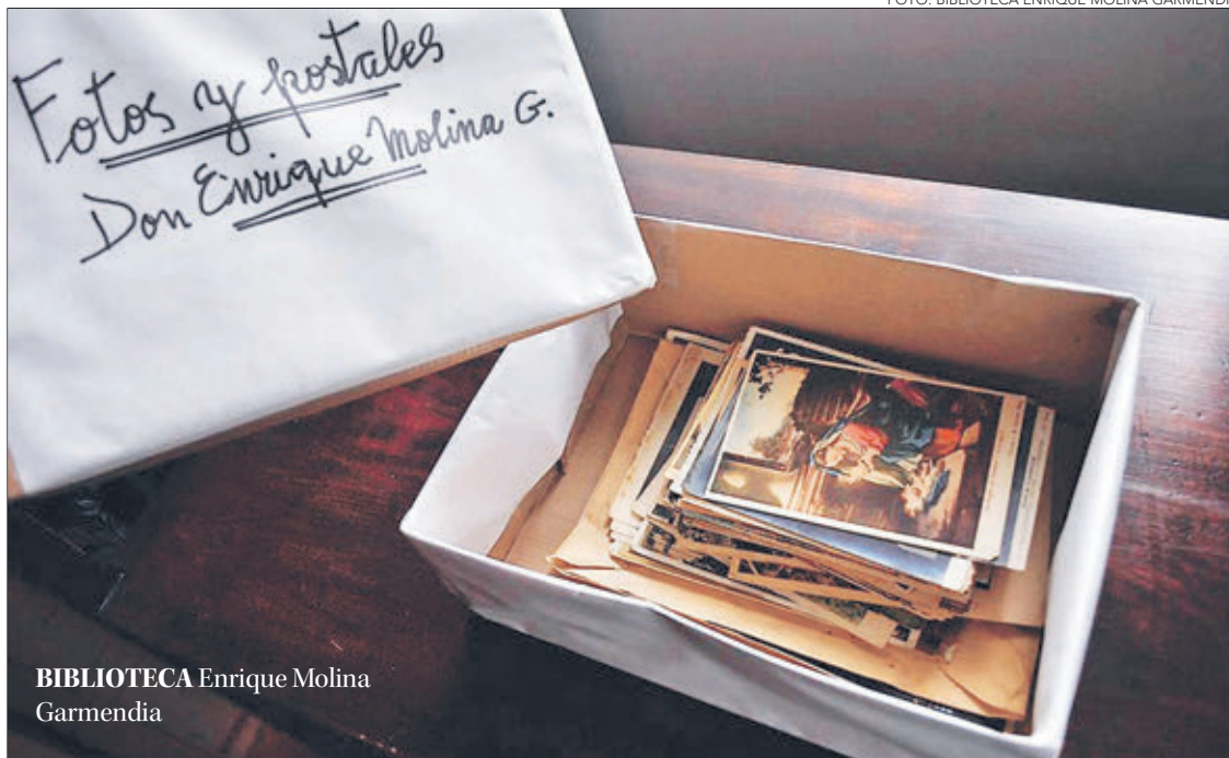
BIBLIOTECA Enrique Molina Garmendia