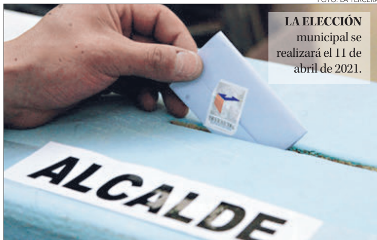
LA ELECCIÓN municipal se realizará el 11 de abril de 2021.

“Tú que eres de esos pocos que pueden quedarse en casa hazlo, porque hay muchos que quisieran y no tienen ese privilegio”.