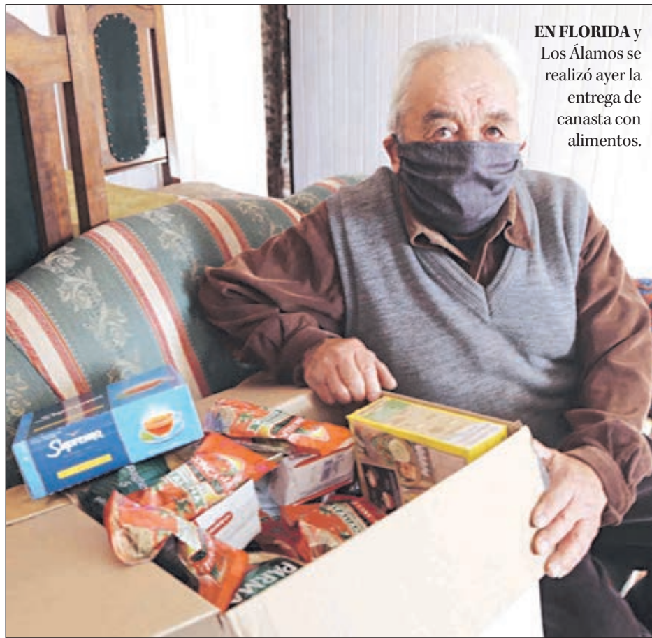
EN FLORIDA y Los Álamos se realizó ayer la entrega de canasta de alimentos.

Twitter @DiarioConce contacto@diarioconcepcion.cl