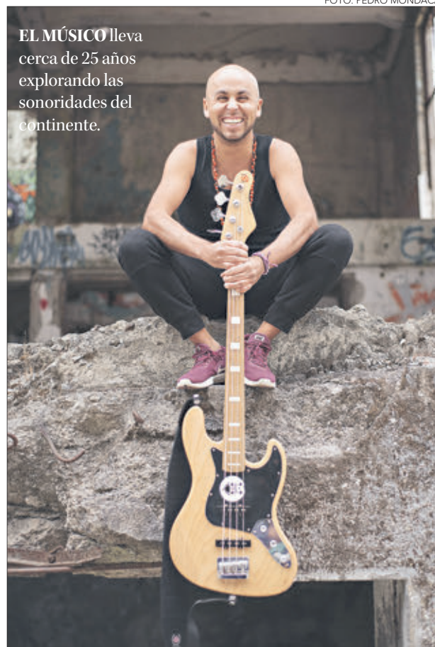
EL MÚSICO lleva cerca de 25 años explorando las sonoridades del continente.

tremendo amigos y amigos músicos que están haciendo su aporte de manera remota”, explicó el multiinstrumentista.