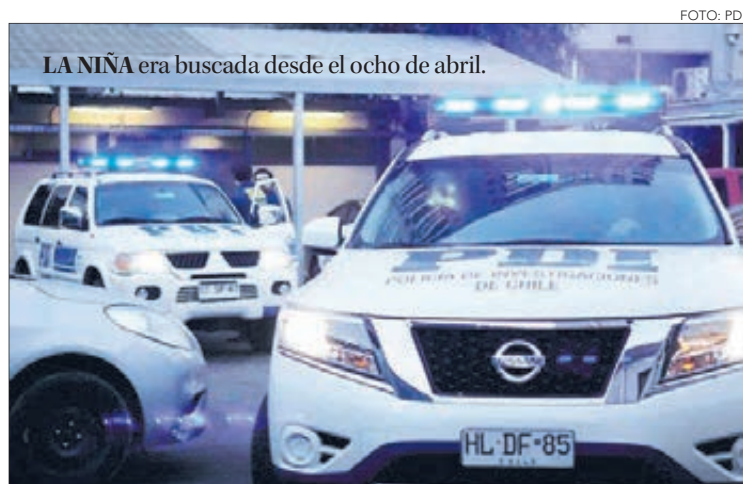
LA NIÑA era buscada desde el ocho de abril.

Twitter @DiarioConce contacto@diarioconcepcion.cl