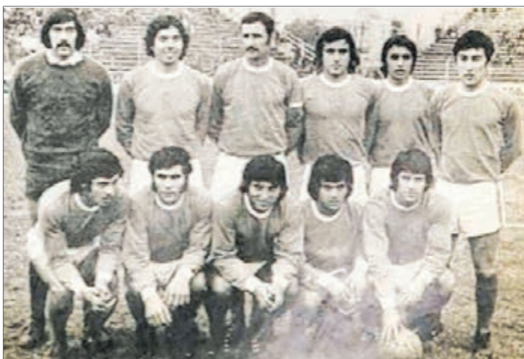
FORMACIÓN DE ESA campaña donde los lilas tuvieron el mejor inicio de su historia. Unión Española les quitó el invicto recién en la fecha 15.