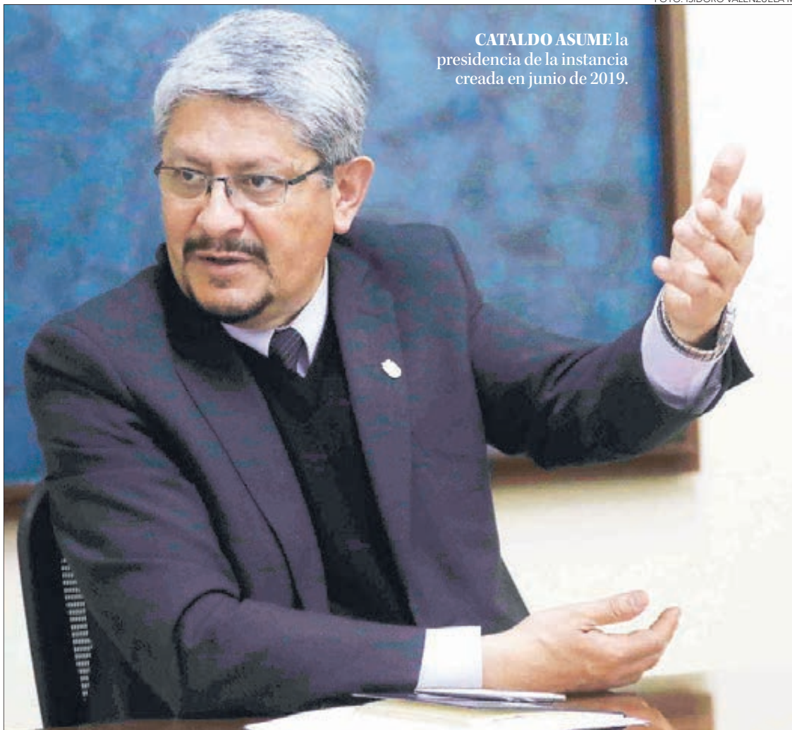
CATALDO ASUME la presidencia de la instancia creada en junio de 2019.

Así, por ejemplo, la UdeC detalló que entre la treintena de acciones que ha llevado a cabo, se encuentra un alto porcentaje de análisis de muestras para detección