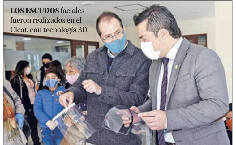
LOS ESCUDOS faciales fueron realizados en el Cicat, con tecnología 3D.