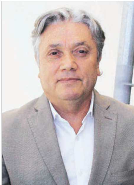
ALEJANDRO NAVARRO , senador. Ingresó al Congreso en 1994, acumula 26 años.