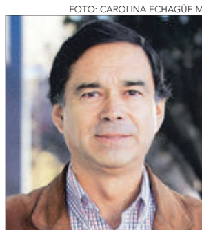
IVÁN NORAMBUENA , diputado. En el cargo desde el 2002, acumula 18 años.