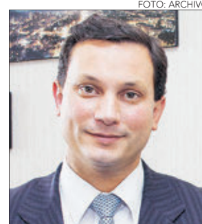
ENRIQUE VAN RYSSELBERGHE , diputado. 10 años.

bien del sistema político. Hace tiempo que el debilitamiento de la democracia en Chile ha sido producto de los mismos representantes políticos. A veces, hay ciertos avances, pero después retrocesos. Con todos preocupados de la Covid-19, no creo que sea posible que se revierta antes que se convierta en Ley sin presión ciudadana”.