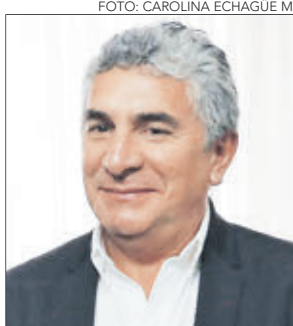
RICARDO FUENTES , el alcalde de Hualqui asumió el cargo el año 2008. 12 años.