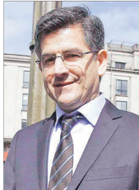
ÁNGEL CASTRO , alcalde de Santa Juana, lleva 20 años como jefe comunal.

EL ESCENARIO REGIONAL DE LAS AUTORIDADES EN CASO DE APROBARSE EL EFECTO RETROACTIVO