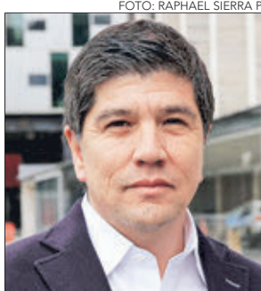
MANUEL MONSALVE , diputado. En el Congreso desde el 2006. 14 años.