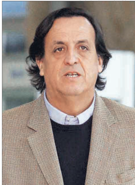
VÍCTOR PÉREZ , senador. Lleva 30 años en el Congreso como diputado y senador.