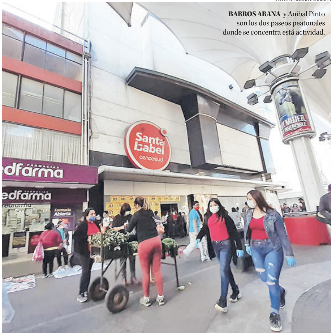
BARROS ARANA y Aníbal Pinto son los dos paseos peatonales donde se concentra esta actividad.