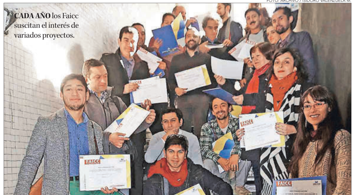
CADA AÑO los Faicc suscitan el interés de variados proyectos.

Hasta fin de mes el municipio penquista tendrá abiertas, vía online , las postulaciones a este importante concurso, que en esta versión 2020 tiene un monto de $17 millones a repartir.