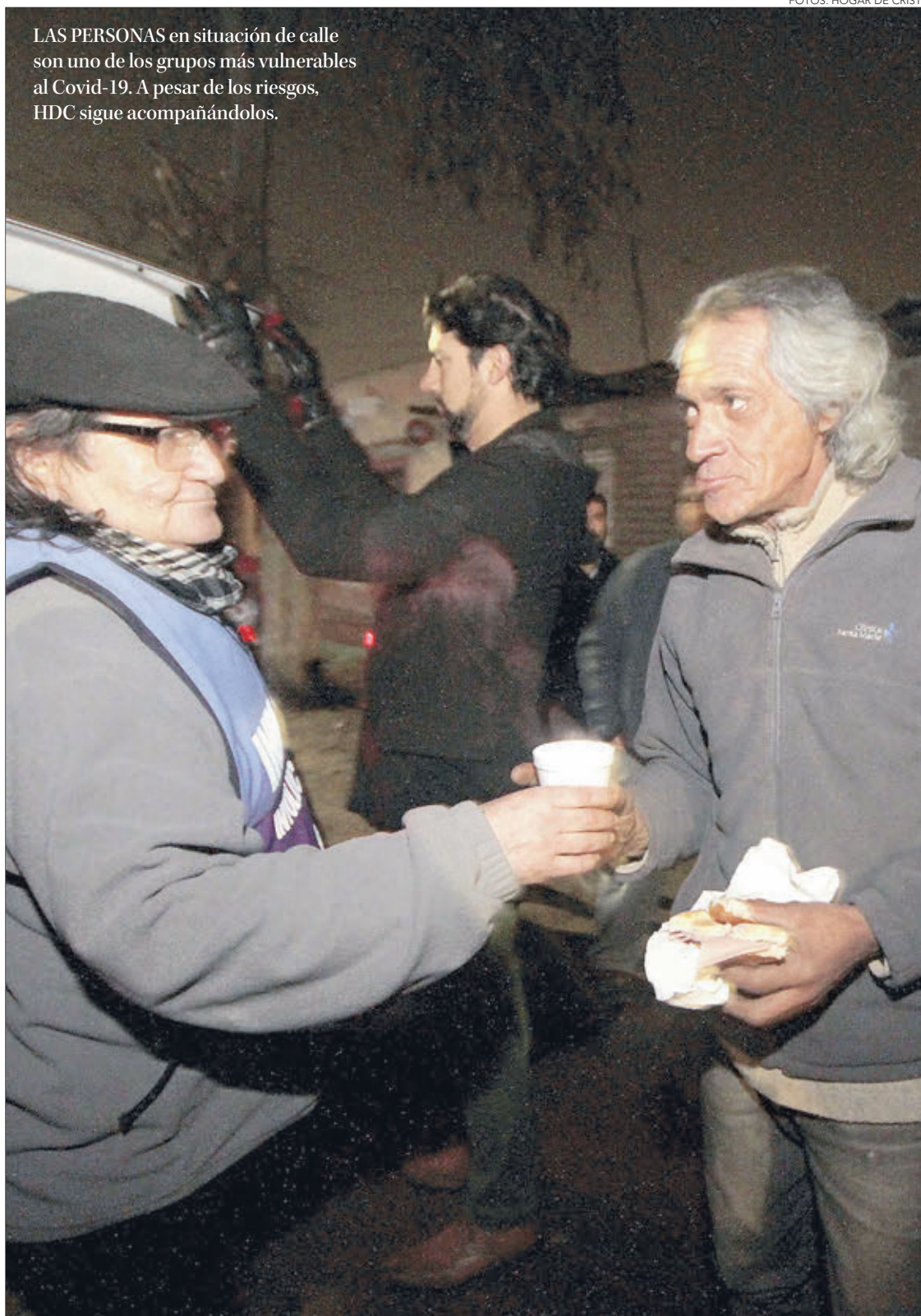
LAS PERSONAS en situación de calle son uno de los grupos más vulnerables al Covid-19. A pesar de los riesgos, HDC sigue acompañándolos.

Una posible cuarentena total, implicaría un enorme desafío para el equipo, y ayuda de la red de salud porque esa persona “requeriría un acompañamiento que nosotros no