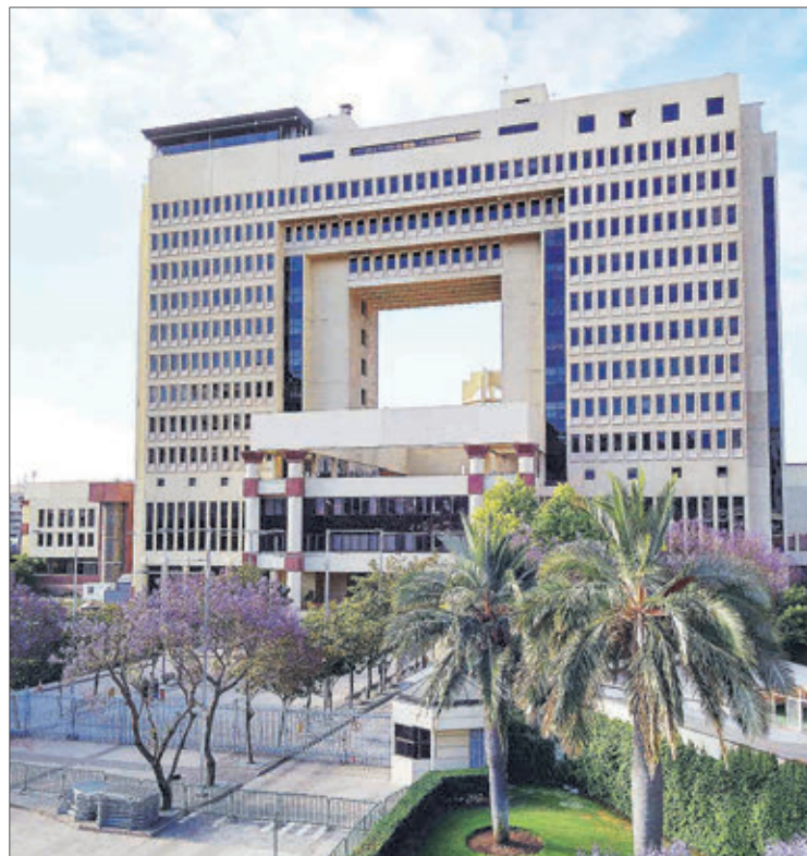
EL PROYECTO había sido votado favorablemente por el Senado la tarde del lunes.

Twitter @DiarioConcepcion contacto@diarioconcepcion.cl