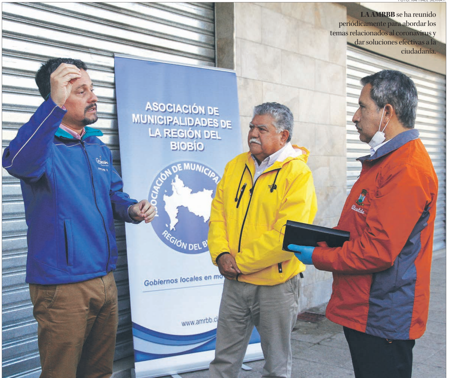
LA AMRBB se ha reunido periódicamente para abordar los temas relacionados al coronavirus y dar soluciones efectivas a la ciudadanía.

Tras la reunión de los miembros de la Asociación de Municipalidades y ante la consulta de la factibilidad de cerrar el Bío Bío, el intendente, Sergio Giacaman, pidió cautela respecto de la solicitud, porque son medidas extremas que deben ser conversadas y tomadas