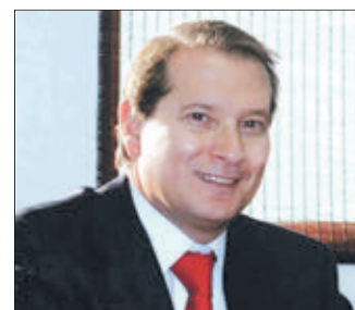
JOSÉ Ignacio Palma, director nacional de Aduanas.

“En términos generales, más allá de la disminución del intercambio comercial de Chile con el mundo, los puertos han seguido operando con relativa normalidad y no se han registrado mayores atrasos o problemas con las cargas, tanto de exportación como de importación”. Y a nivel institucional, desde la semana pasada se ha determinado la realización de turnos presenciales mínimos y la opción de teletrabajo. “El desafío que tenemos como Aduanas y que se debe proyectar para al menos el primer semestre del 2020, es generar las condiciones necesarias para continuar colaborando con el desarrollo del comercio exterior, sin descuidar nuestra labor de control y fiscalización”.