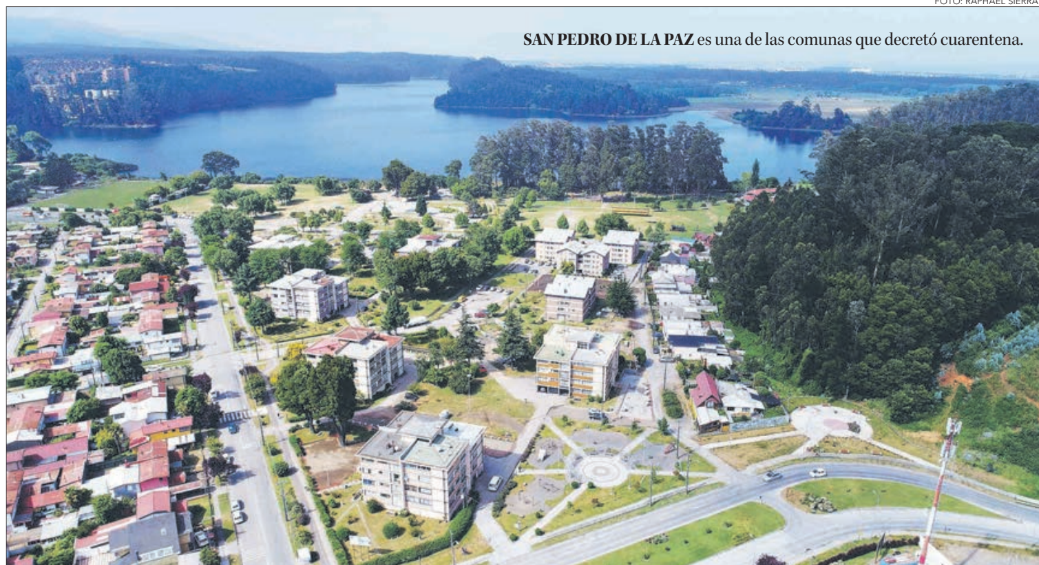
SAN PEDRO DE LA PAZ es una de las comunas que decretó cuarentena.

Tras la medida adoptada por San Pedro de la Paz, Lota y Coronel, líderes de otras comunas señalaron que la decisión “solo es una normativa simbólica”.