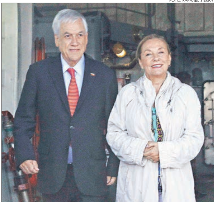
EL PRESIDENTE y la Primera Dama recorriendo el Piloto Pardo.

Agregó que recibió una invitación, pero le prohibieron asistir con acompañantes, con su equipo. Por ello, no participó del acto.