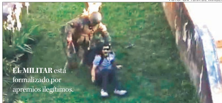
EL MILITAR está formalizado por apremios ilegítimos.