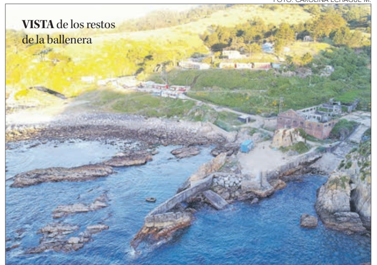
VISTA de los restos de la ballenera