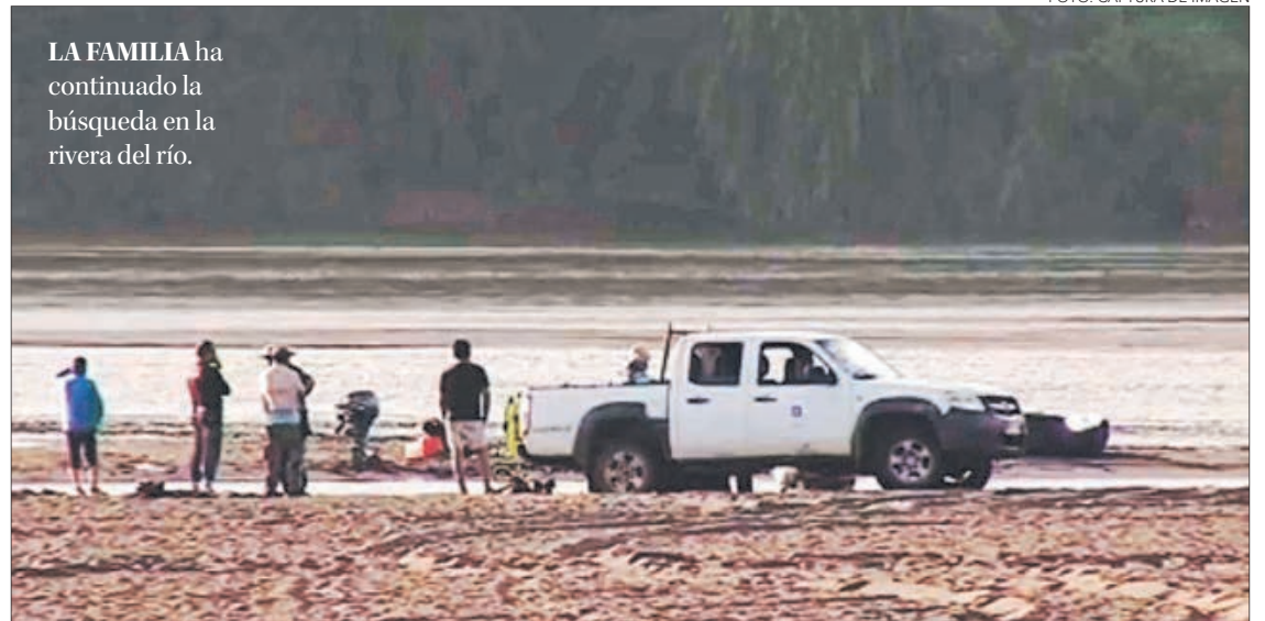
LA FAMILIA ha continuado la búsqueda en la riberia del río.