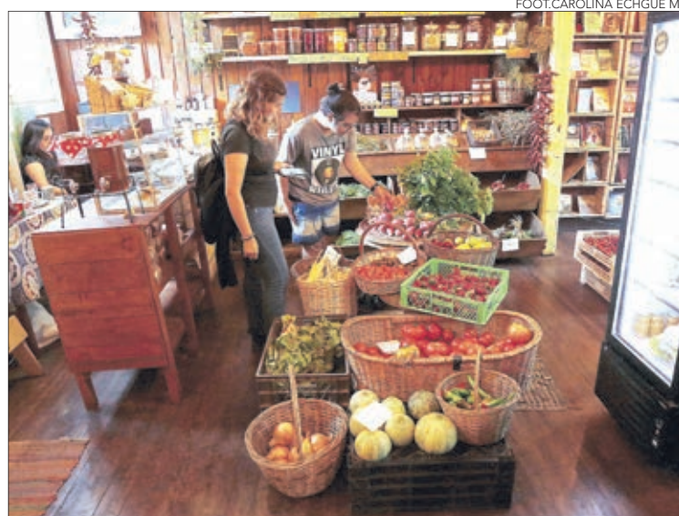
FOOT:CAROLINA ECHGUE M.

Twitter @DiarioConce contacto@diarioconcepcion.cl