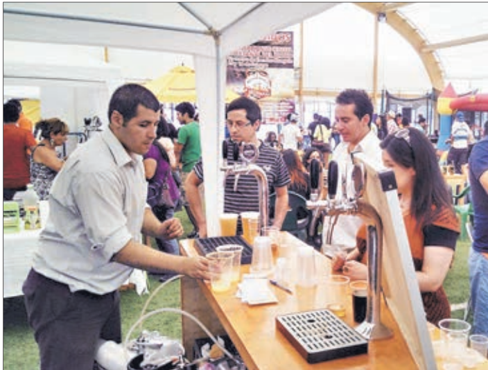
FOTO. ENVIADA FIESTA DE LA CERVEZA 2020

La Fiesta de la Cerveza se desarrollará desde las 12:00 horas hasta las 21:30 horas. El costo de ingreso por persona será de $2.000, con la opción de ingreso de 2x1 hasta las 15:00 horas. Niños y adultos mayores ingresan gratis. Se considera estacionamiento gratuito para los asistentes.