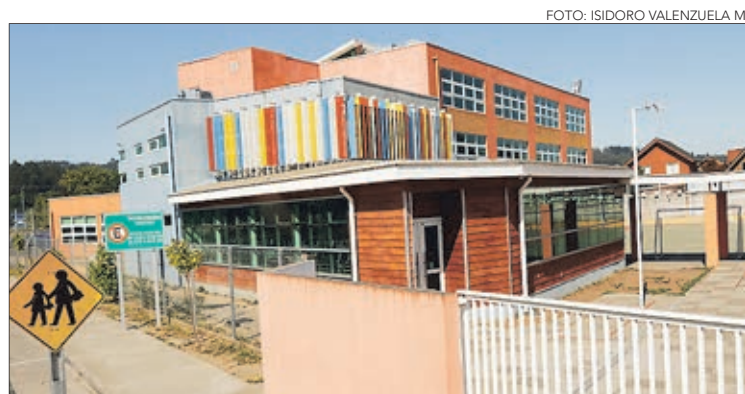
LA FACHADA DEL COLEGIO Almondale del Valle.

Twitter @DiarioConcepcion contacto@diarioconcepcion.cl