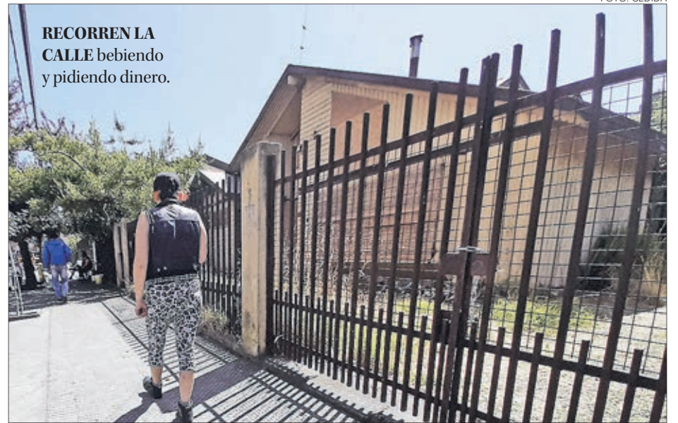
RECORREN LA CALLE bebiendo y pidiendo dinero.

LA FERIA NO sólo es una oportunidad para el turista, sino también para el fomento del comercio local.