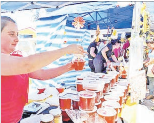
LA MIEL Y una serie de subproductos estarán presentes en la actividad.