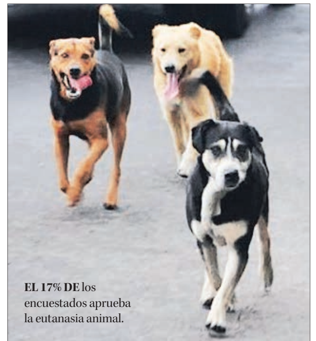
EL 17% DE los encuestados aprueba la eutanasia animal.