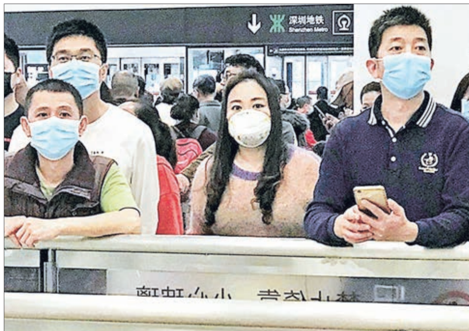
EN CHINA existen restricciones particulares en aeropuertos por el brote de Coronavirus.

Pero su retorno no ha sido fácil, ayer tuvo otros inconvenientes. Contó que sólo podía traer dos maletas, pero entre las ambas no podía superar los 30 kilos. No obstante, cada una llegaba a los 23 kilos. Por ello, se tuvo de deshacer de algunas cosas. Además, tuvo que cancelar