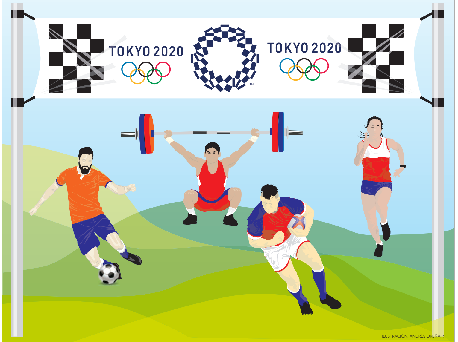
ILUSTRACIÓN: ANDRÉS OREÑA P.

Con 10 deportistas clasificados y otros tres cupos asegurados, Chile entró en tierra derecha en la carrera por sumar nuevos deportistas a los Juegos Olímpicos. Este es el mapa.