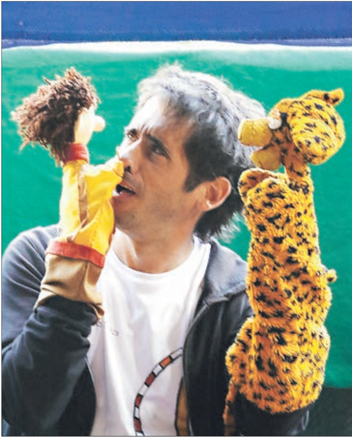
LA OBRA URUGUAYA "La fábrica de títeres" se presentó ayer en la segunda jornada del evento.