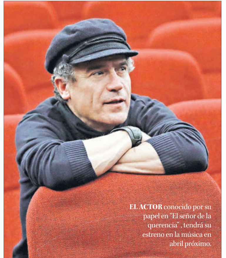
EL ACTOR conocido por su papel en "El señor de la querencia", tendrá su estreno en la música en abril próximo.

formar una paralela dedicada a la música.