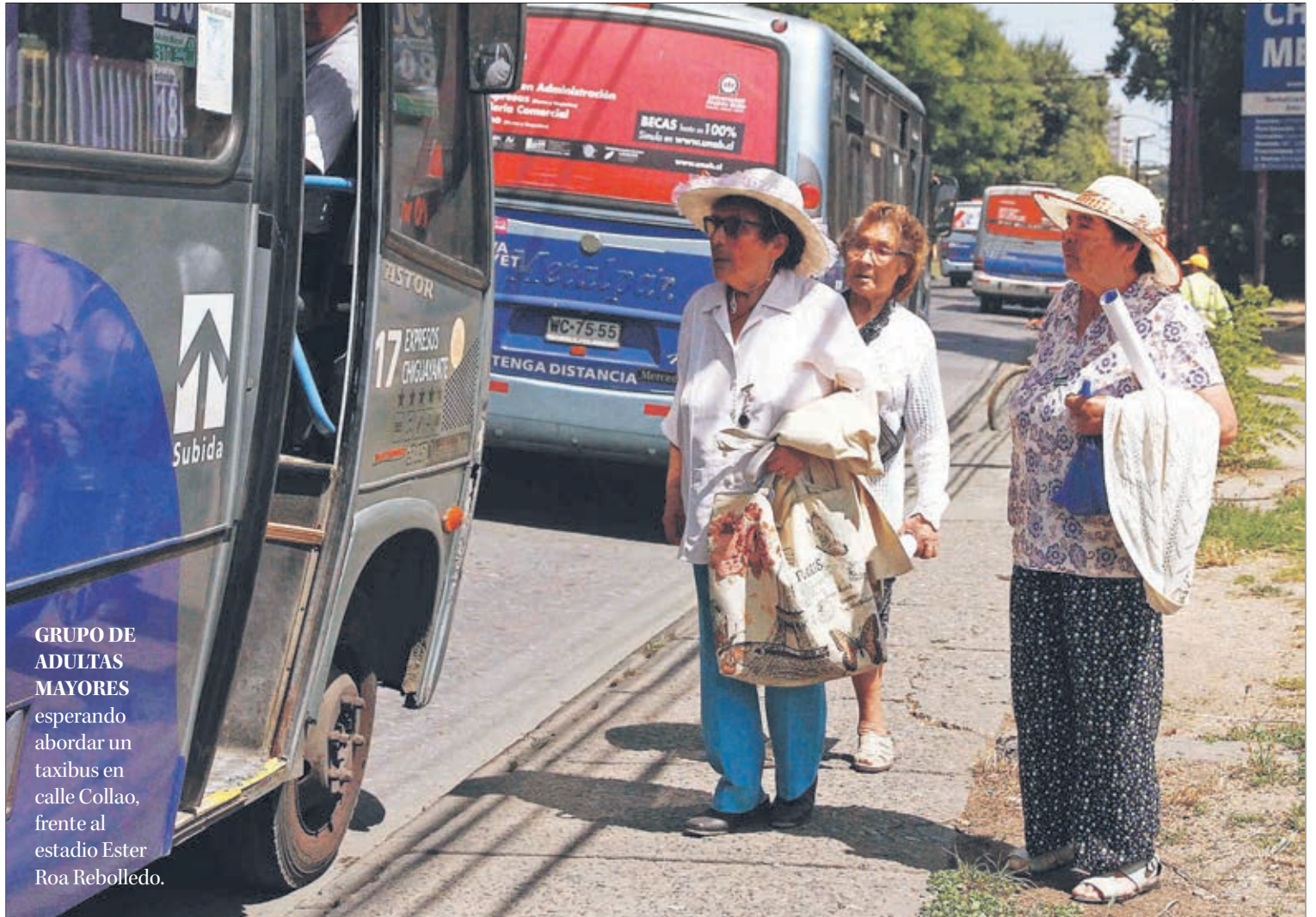
GRUPO DE ADULTAS MAYORES esperando abordar un taxibus en calle Collao, frente al estadio Ester Roa Rebolledo.