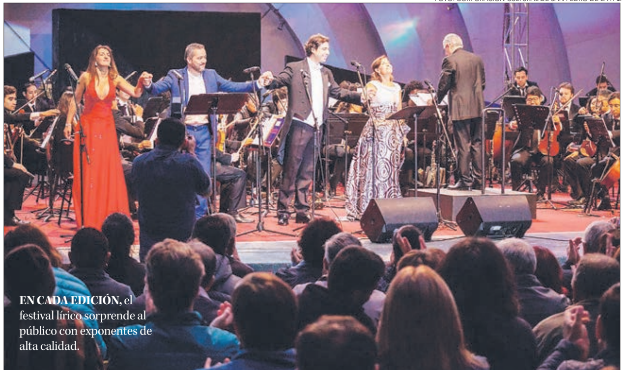
EN CADA EDICIÓN, el festival lírico sorprende al público con exponentes de alta calidad.