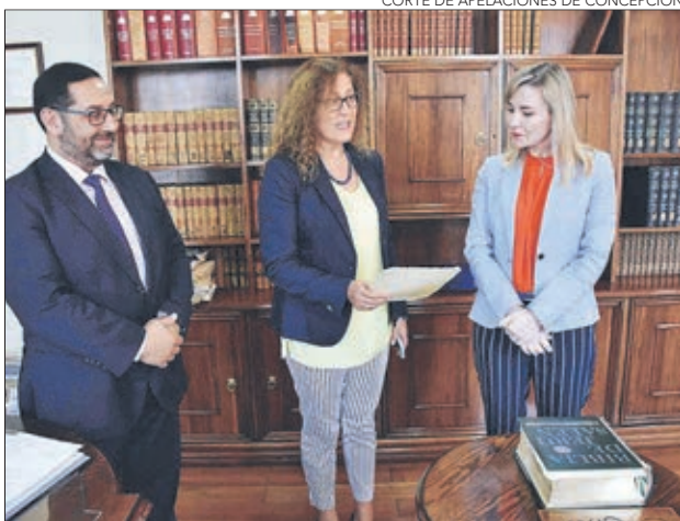
CORTE DE APELACIONES DE CONCEPCIÓN

La profesional, que inició su carrera judicial como jueza titular del Juzgado de Fa-