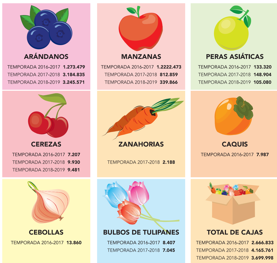
ILUSTRACIÓN: ANDRÉS ORENANA

tra fruta y su proyección en el tiempo”, resaltó Lagos.