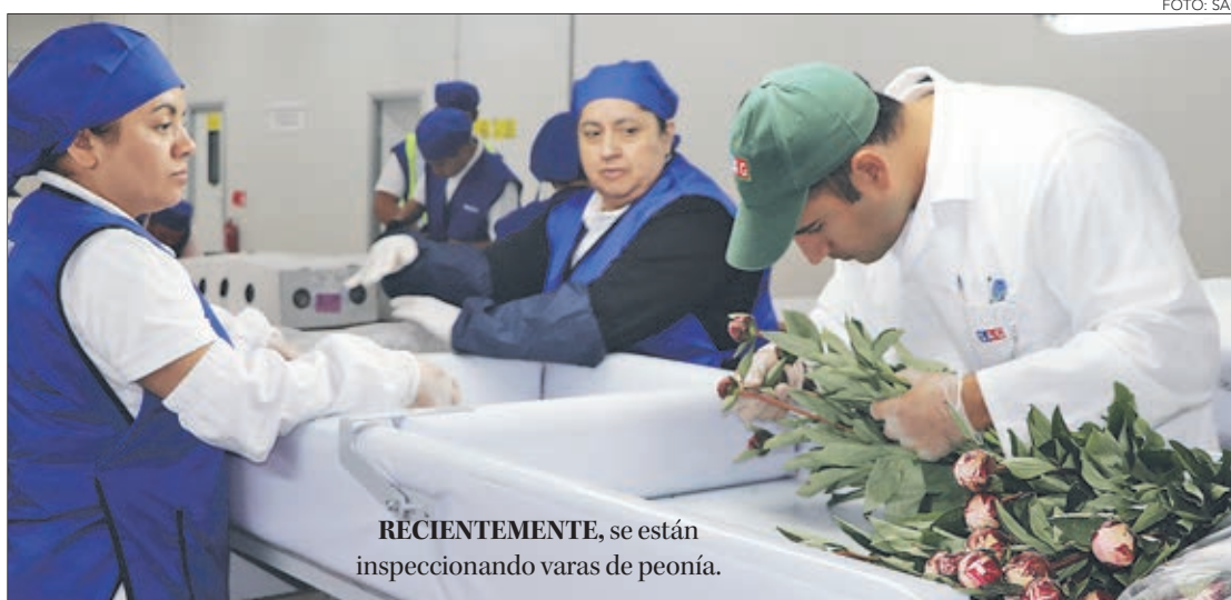
RECIENTEMENTE, se están inspeccionando varas de peonía.

“Este sitio está ubicado en un lugar estratégico, cuenta con una excelente conectividad con la carretera y los puertos de la Región. Y, producto del cambio climático, en los próximos años aumentará la superficie de huertos de frutas en nuestra zona, por lo que este sitio es muy importante para el comercio de nues-