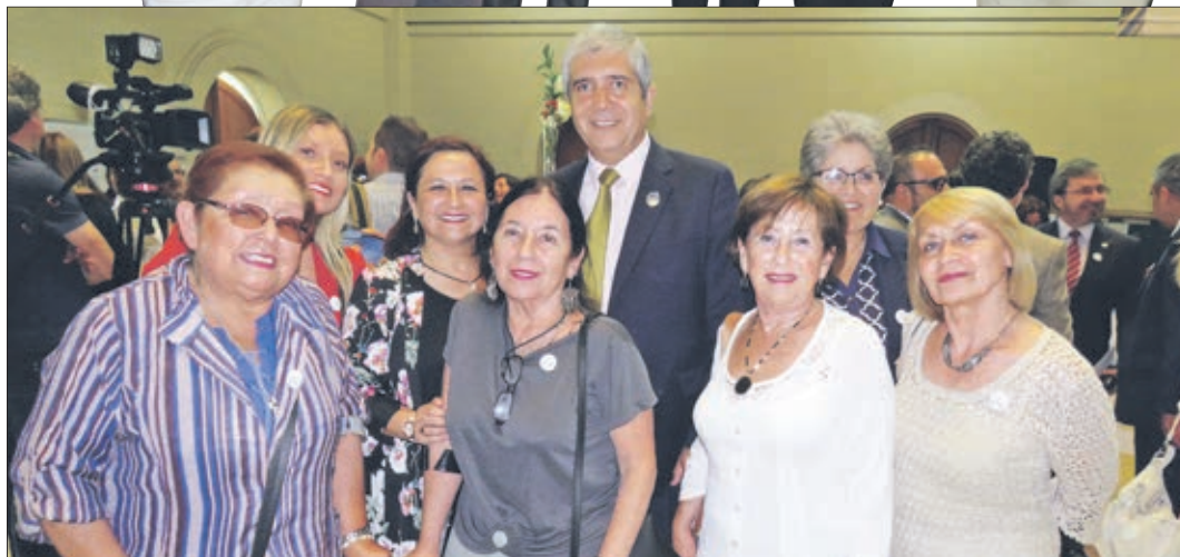
RECTOR CARLOS SAAVEDRA, junto a exalumnas de la Universidad de Concepción.