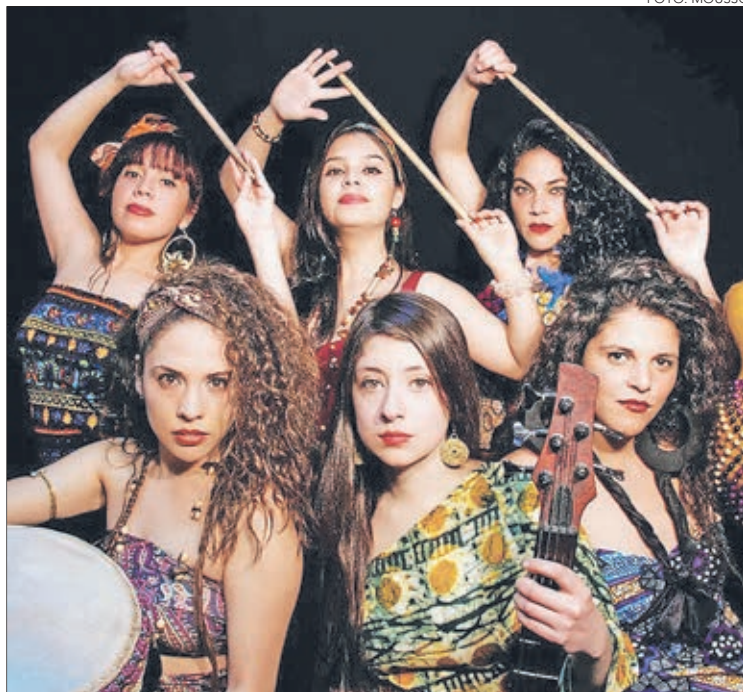
AGRUPACIÓN MOUSSO será uno de los platos fuertes del evento.

La programación comenzará este sábado, a partir de las 15:00 horas, con el acto inicial de esta edición: el “Carnaval negro del Bío Bío”, que recorrerá gran parte del Parque Ecuador, comenzando en calle Angol con Víctor Lamas. Luego y para cerrar la primera jornada, a partir de las 22:00, se realizará la tradicional “Noche de tambor-