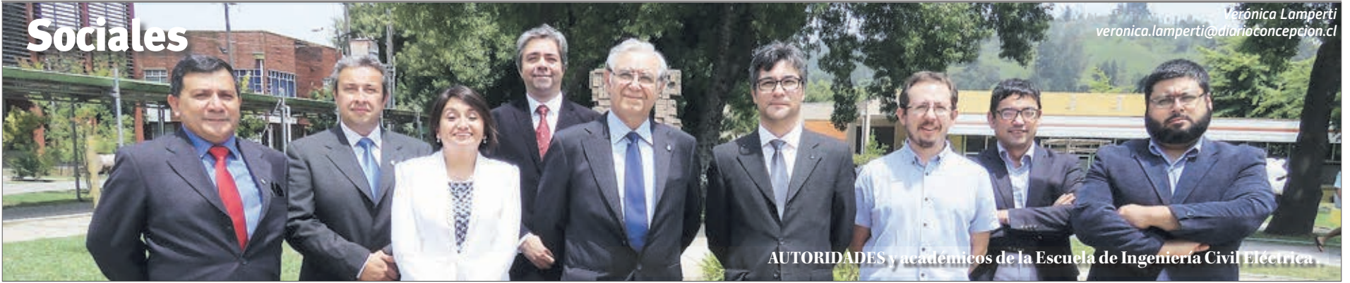
AUTORIDADES y académicos de la Escuela de Ingeniería Civil Eléctrica

Verónica Lamperti veronica.lamperti@diarioconcepcion.cl