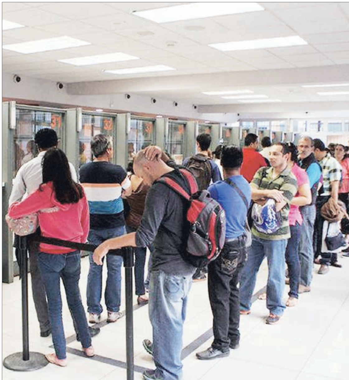
AUMENTO DE COTIZACIÓN CON CARGO AL EMPLEADOR

- Nuevo pilar de Ahorro Colectivo y Solidario. Este fondo será financiado por los empleadores y corresponde, como ya se indicó a un 3%, y, además, contará con un aporte inicial por parte del Estado. El objetivo de este fondo colectivo es funcionar con una lógica de re-