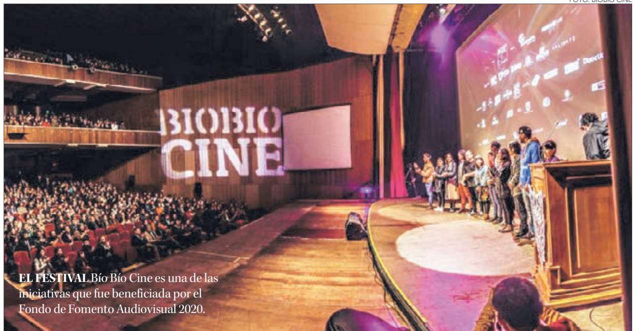
EL FESTIVAL Bío Bío Cine es una de las iniciativas que fue beneficiada por el Fondo de Fomento Audiovisual 2020.