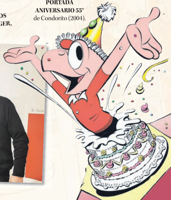
PORTADA ANIVERSARIO 55° de Condorito (2004).