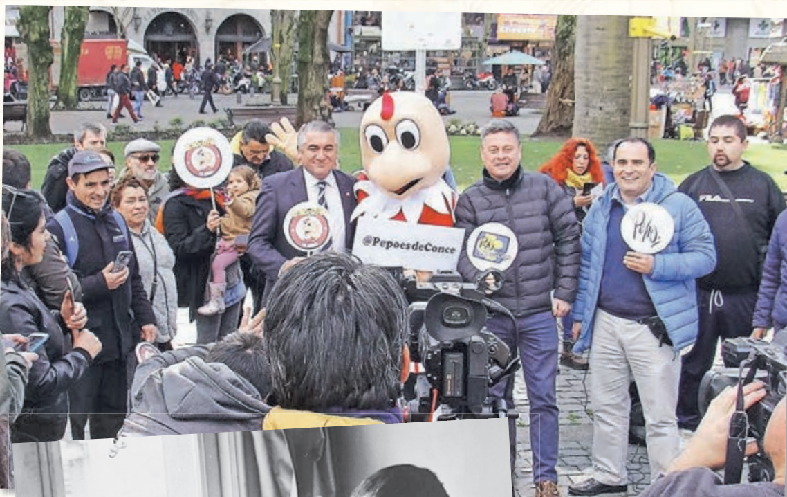
CUMPLEAÑOS de Condorito en Concepción (agosto 2019).

Ha sido un año agridulce. En febrero, se cerró la revista Condorito, justo en el año cuando el pajarraco cumplió 7 décadas de vida. Sin embargo, este mismo 2019, Concepción despertó su interés por la figura de su hijo ilustre, René Ríos Boettiger, Pepo, quien, sin lugar a dudas, es el penquista más famoso del mundo y que hace poco estuvo de cumpleaños.