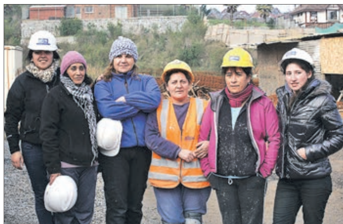
LA INICIATIVA buscó mejorar la visibilización del trabajo femenino en el rubro de la construcción y su empleabilidad.

El programa, implementado por la entidad gubernamental, se realizó en el marco de una mesa de trabajo conformada por diversas entidades productivas de la región para lograr una mayor inclusión laboral de