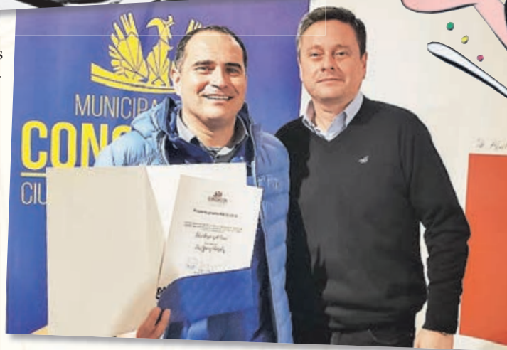
ENTREGA Premio Faicc (junio 2019).

El primero de ellos, fue el financiero, por medio de un fondo Faicc,