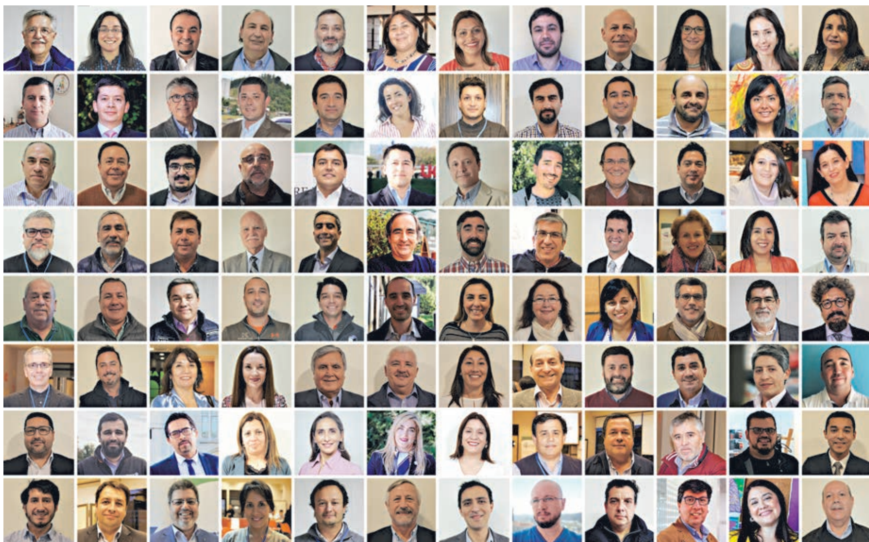
Las fotos corresponden a los mentores que han suscrito un acuerdo de participación con la Red hasta el 13 de diciembre 2019.

¡Sigamos aportando y trabajando juntos por un Chile más emprendedor!