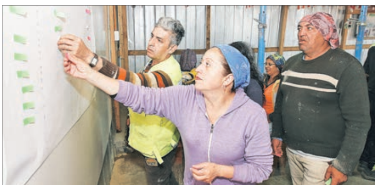
LA FINALIDAD DE ESTOS TALLERES fue recoger las inquietudes y anhelos de los trabajadores para mejorar la gestión del gremio en el ámbito social.

La finalidad fue invitar a los colaboradores a conversar so-